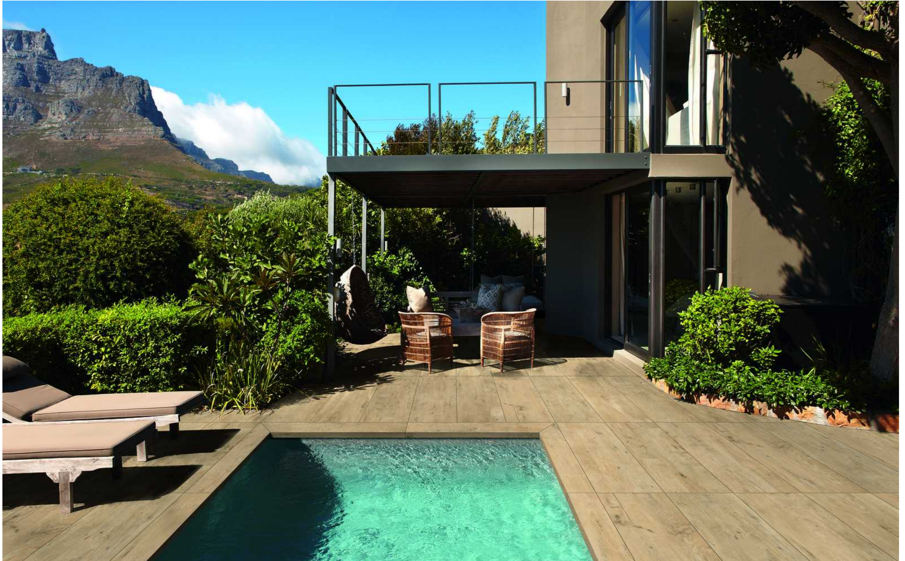
MUKL Treverkdear20 Beige Elemento L 15x120cm MCN7 Treverkdear20 Beige Rettificato 40x120cm