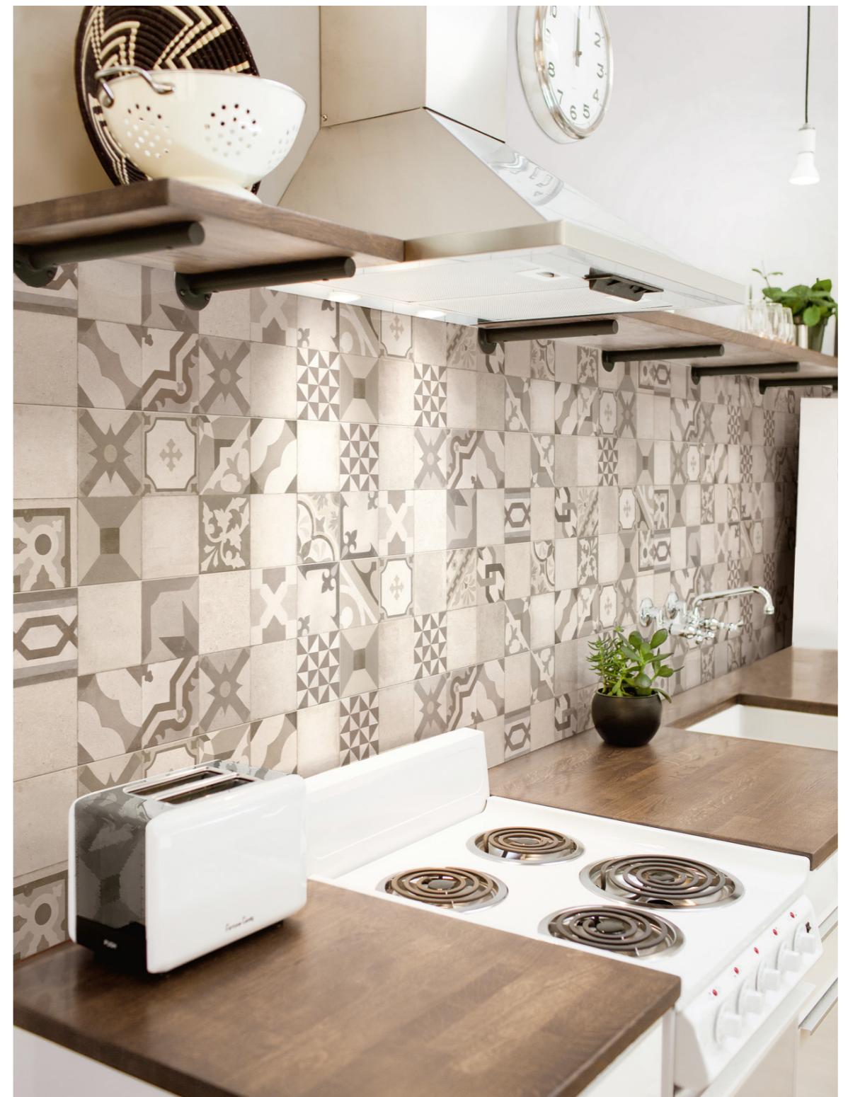
M13D Work Beige Decoro Vantage 30x90cm