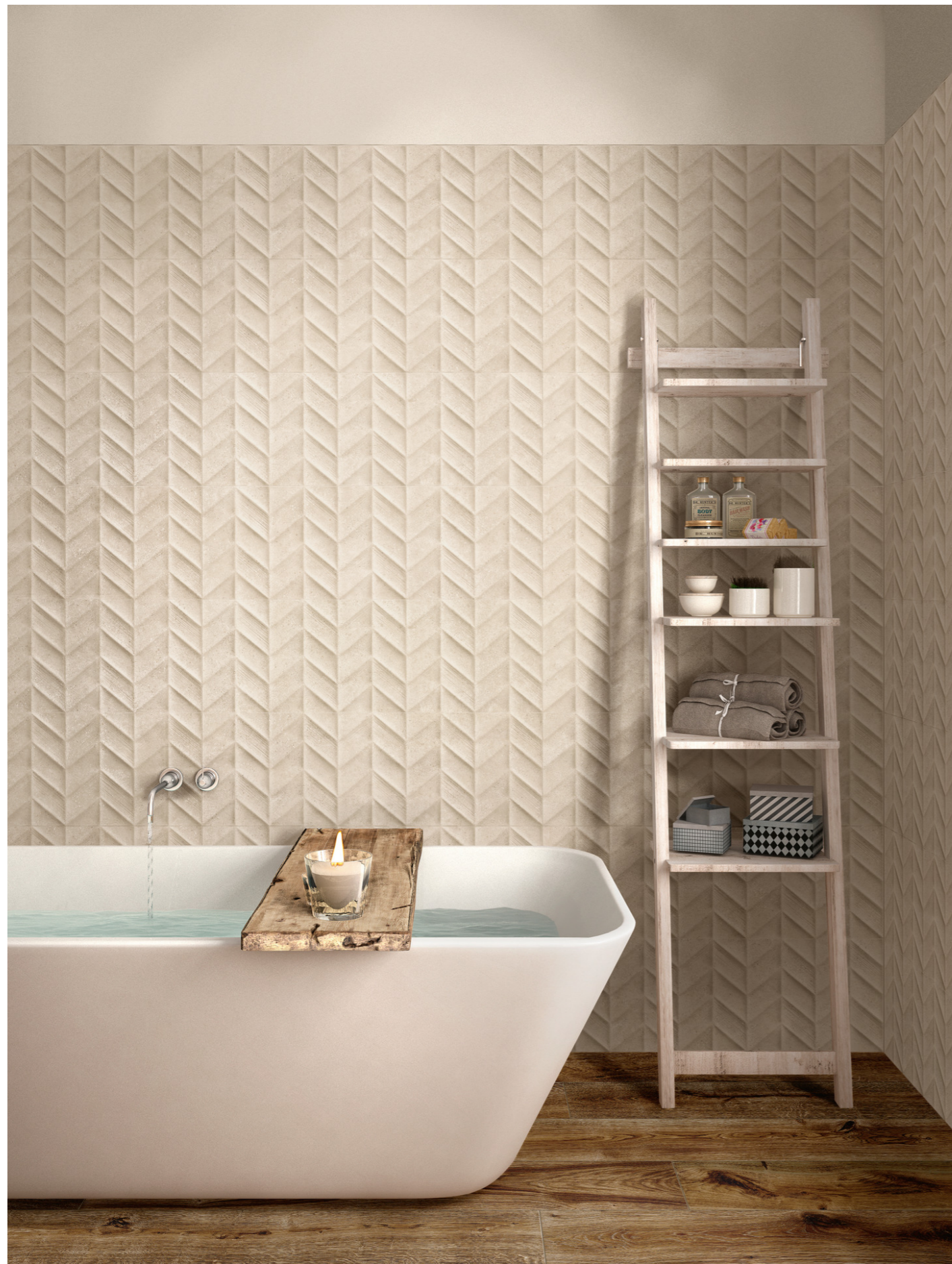
M13A Work Beige Struttura 3D Spike 30x90cm