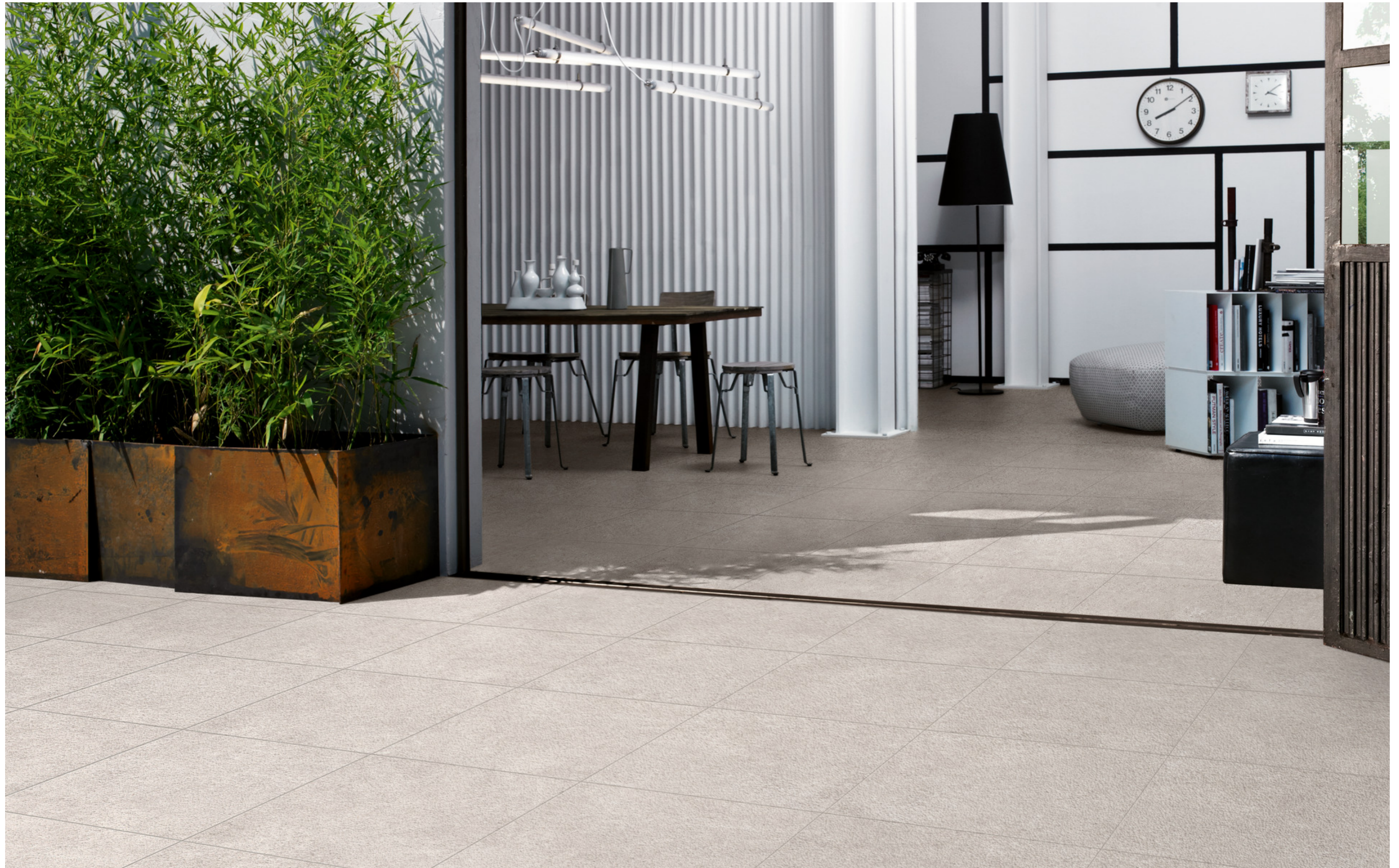
M8ZA Work Beige Outdoor C3 Rt 60x60cm M8Z7 Work Beige Rt 60x60cm