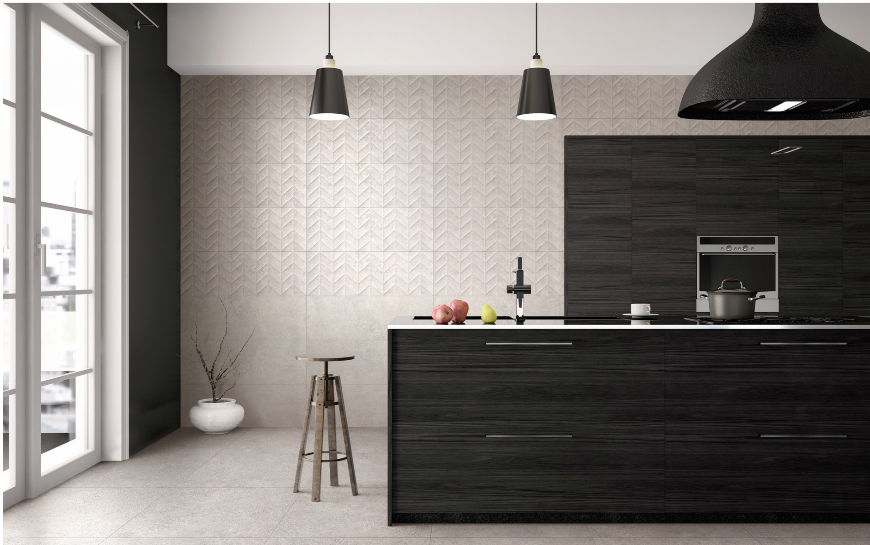
M139 Work Grey Struttura 3D Spike 30x90cm M133 Work Grey 30x90cm