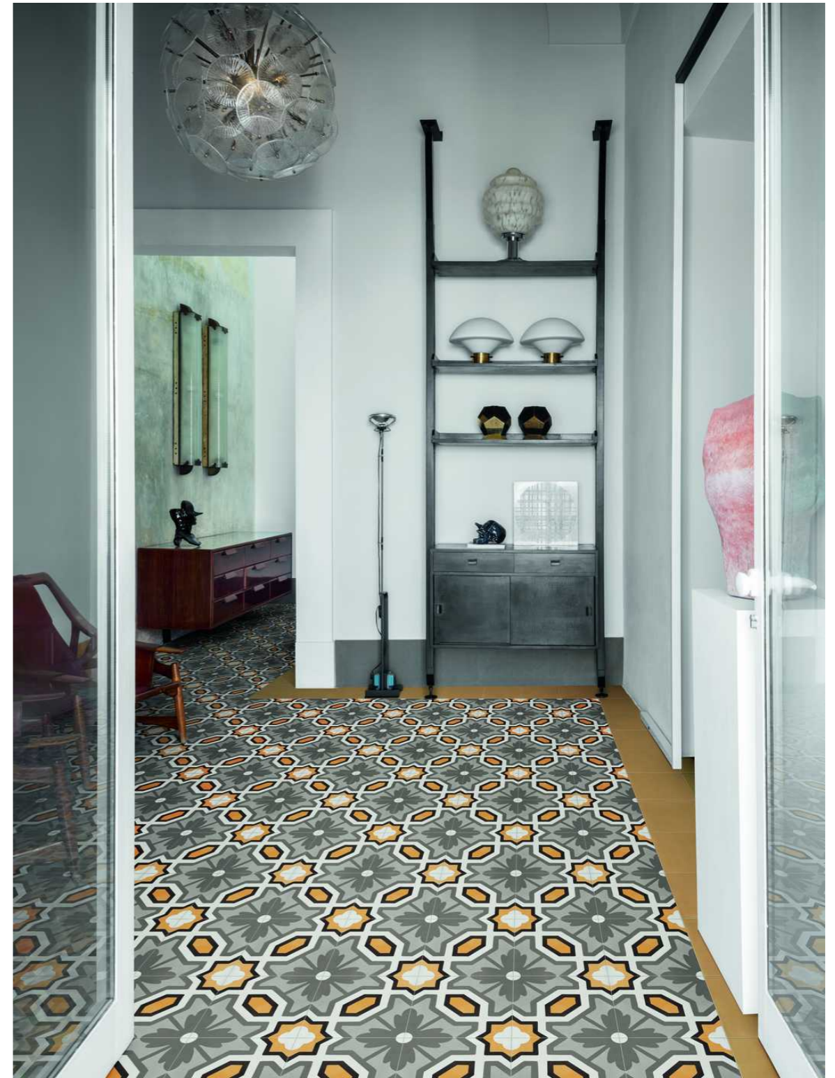
M1L5 D_Segni Colore Tappeto 6 20x20cm M1KT D_Segni Colore Mustard 20x20cm