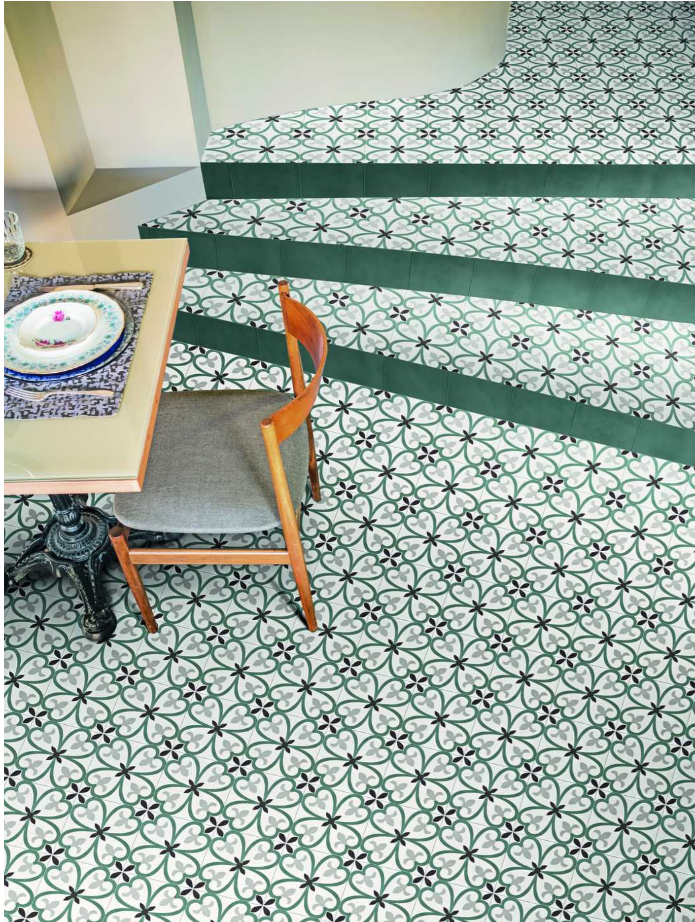
M1L4 D_Segni Colore Tappeto 5 20x20cm M1KV D_Segni Colore Indigo 20x20cm