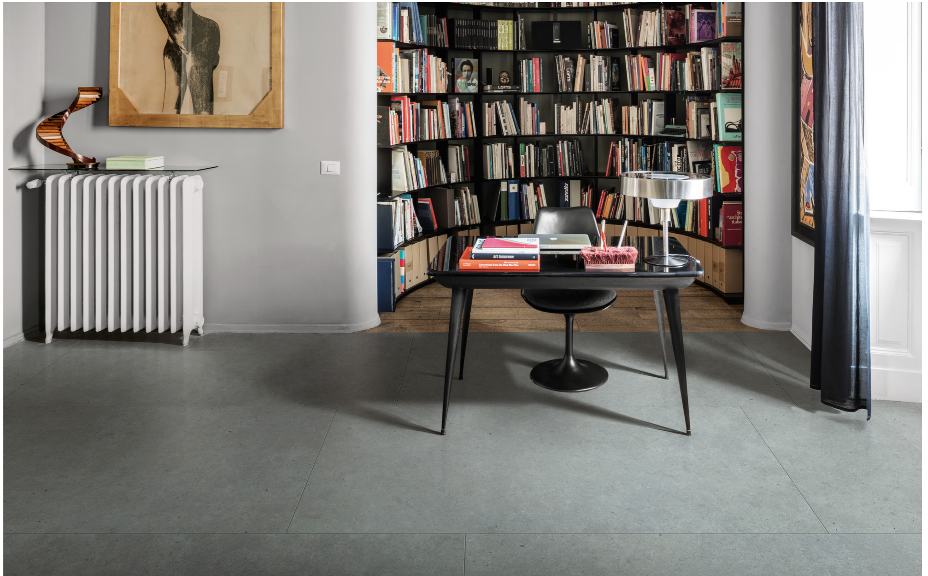
M7C0 Vero Rovere Rt 20x120cm M6AS Moon Anthracite Rt 90x180cm