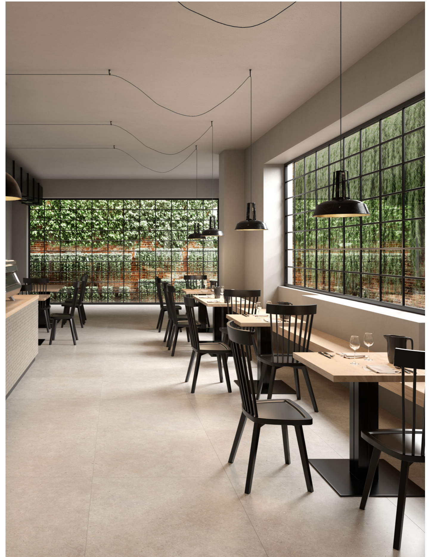
M8LJ Moon White Mosaico Spaccatella 30x30cm M6DS Moon White Rt 90x90cm