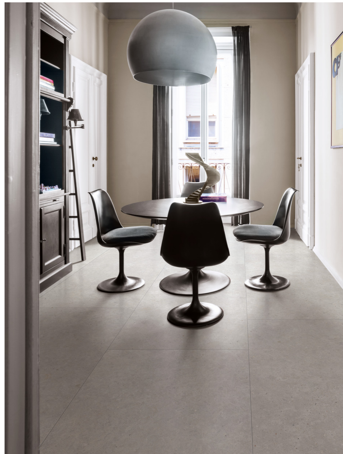
M6AX Moon White Rt 90x180cm