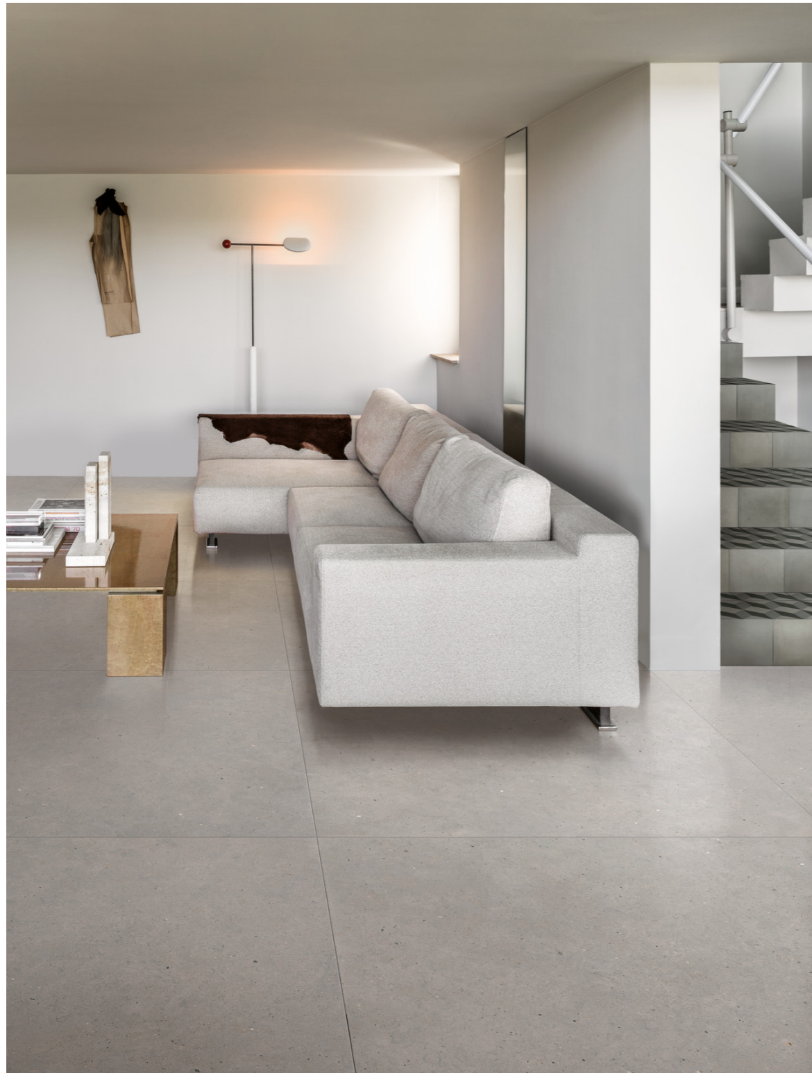
M903 Moon White Rt 120x120cm M60W D_Segni Blend Tappeto 10 20x20cm M603 D_Segni Blend Carbone 20x20cm