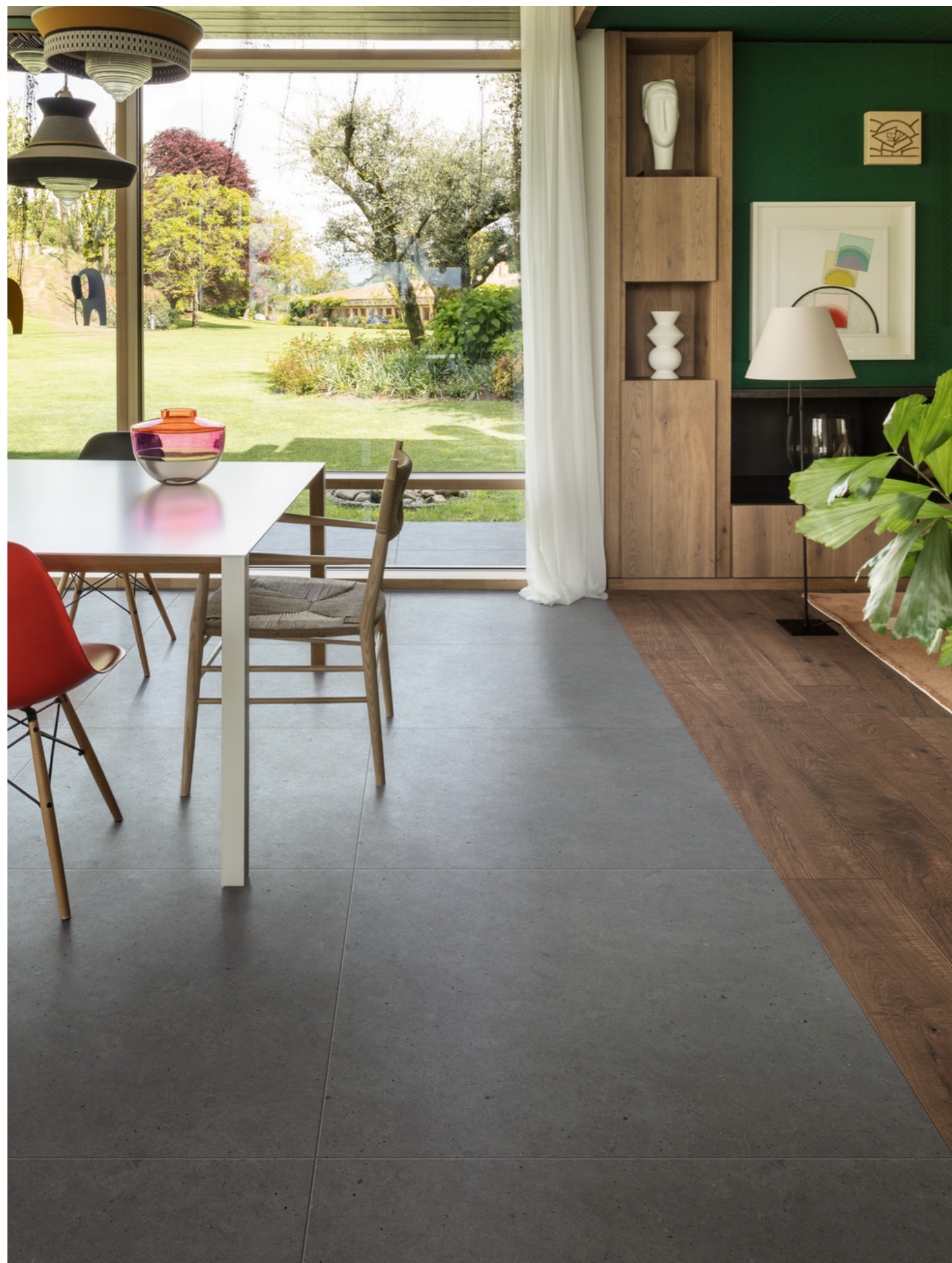
M7AW Vero Quercia Rt 22x180cm M6AZ Moon Anthracite Rt 90x90cm