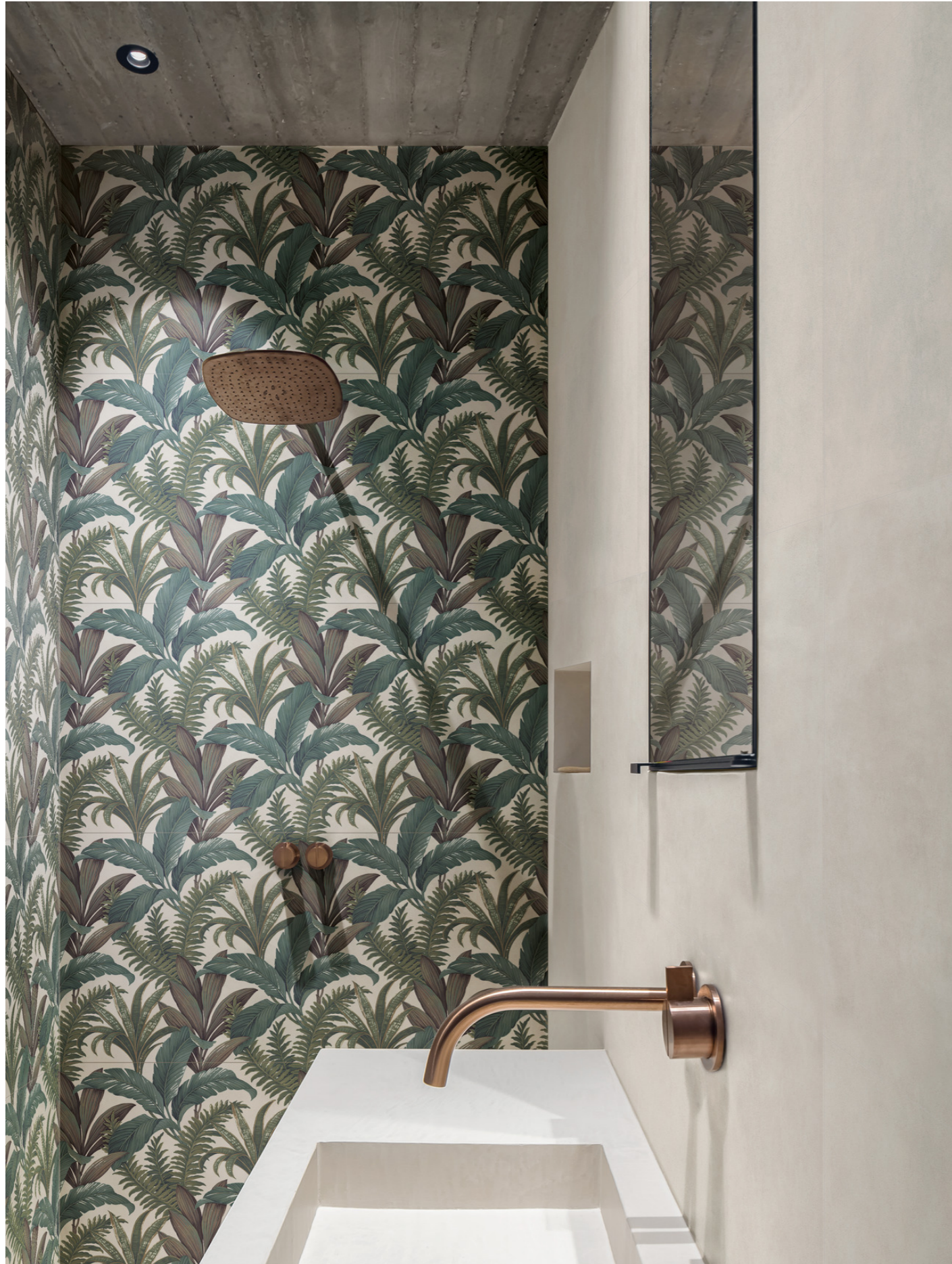
MCSN Poster White Rt 60x120cm MAD9 Poster Decoro Hawaii Rt 60x120cm