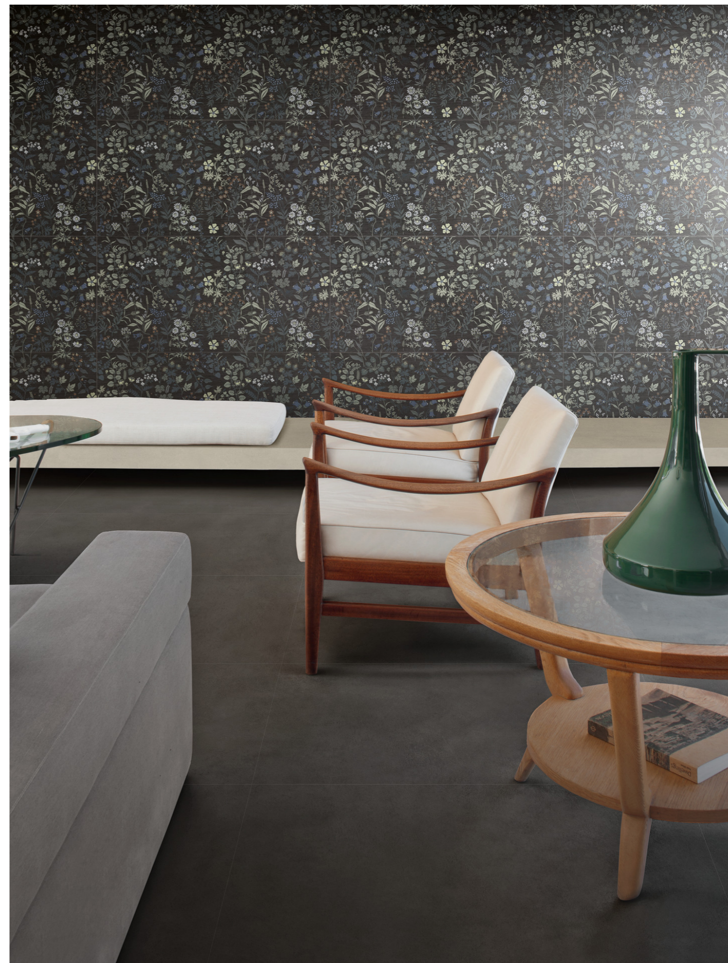
MCSQ Poster Anthracite Rt 60x120cm MAD8 Poster Decoro Exotic Rt 60x120cm