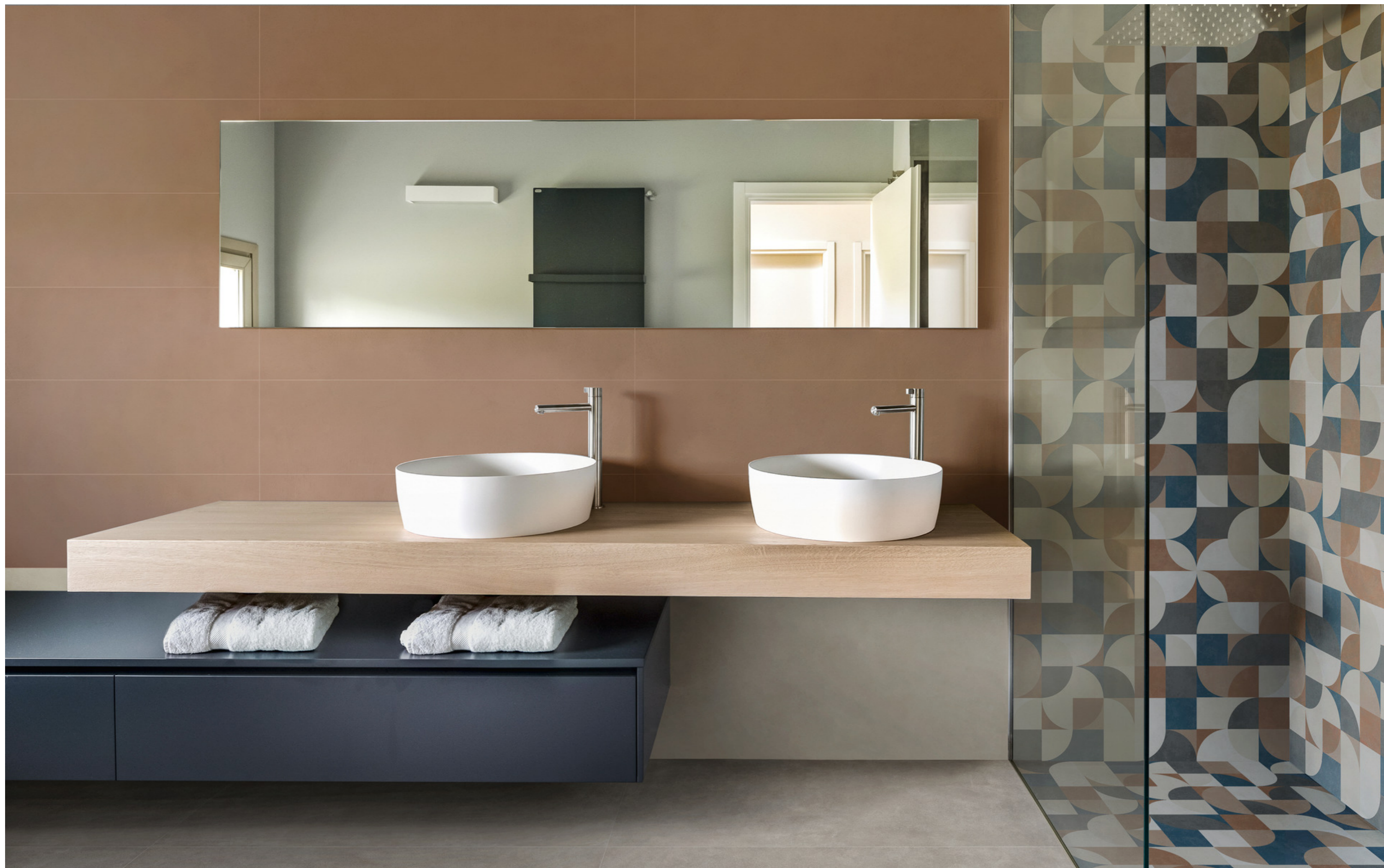
MCSF Poster Ivory Rt 60x120cm MADE Poster Decoro Zone Rt 60x120cm