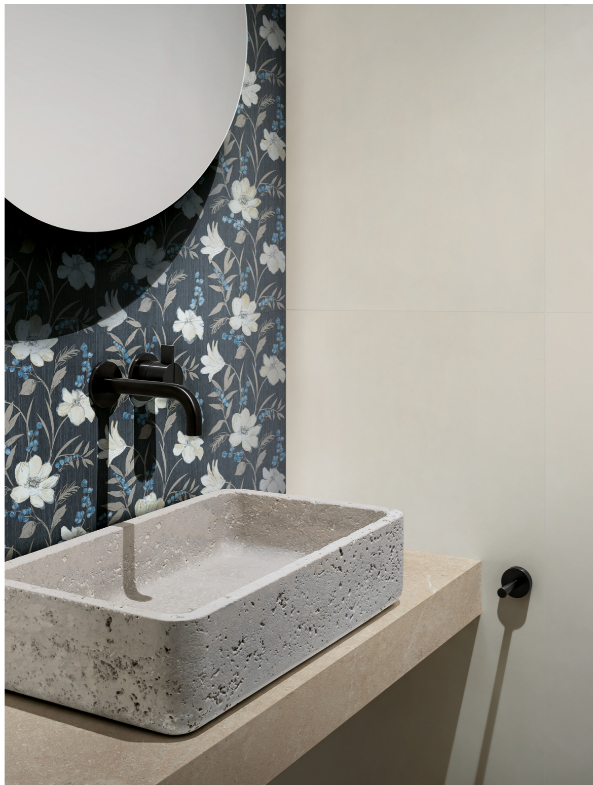
MCSQ Poster Anthracite Rt 60x120cm MAD8 Poster Decoro Exotic Rt 60x120cm