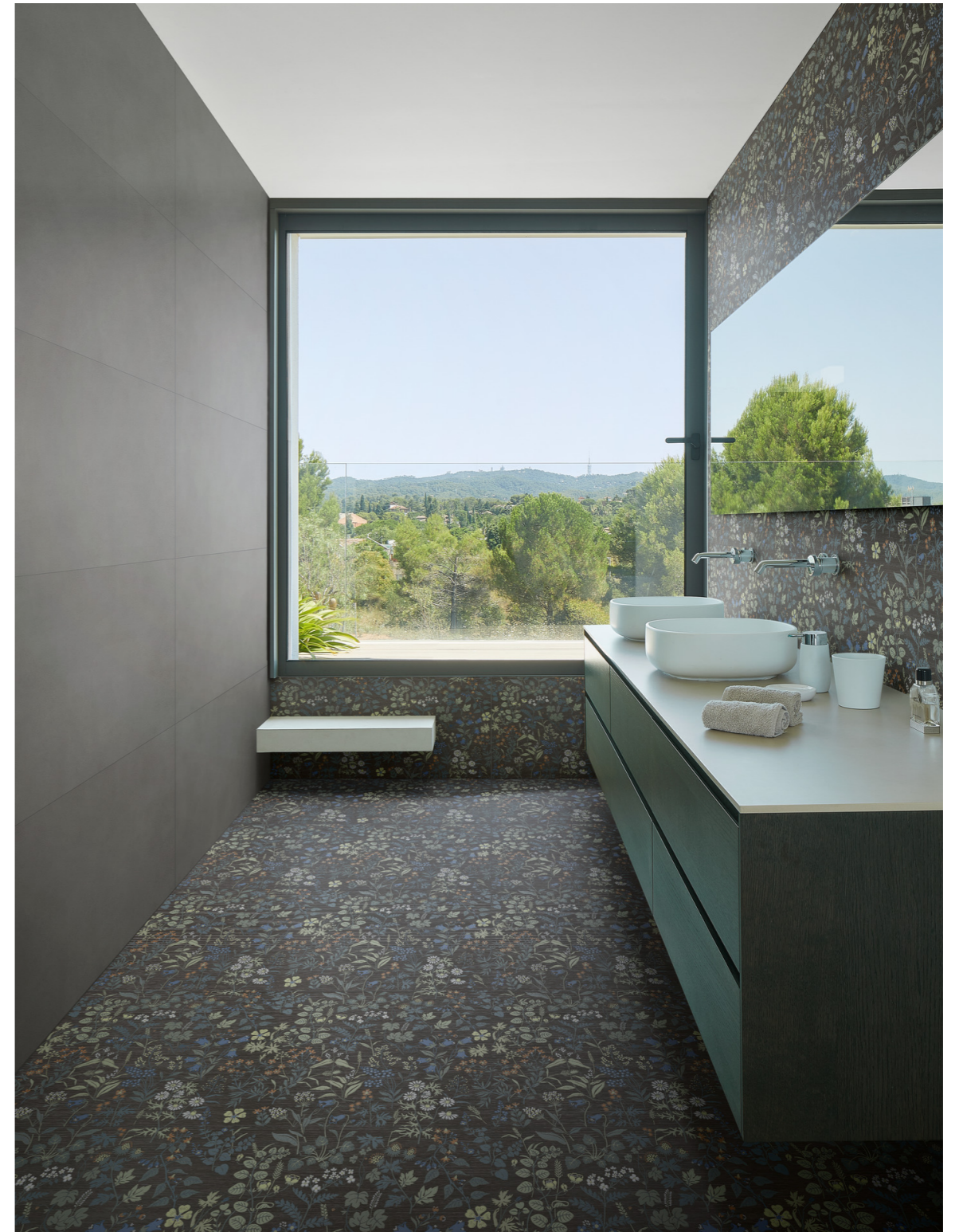
MCSQ Poster Anthracite Rt 60x120cm MAD8 Poster Decoro Exotic Rt 60x120cm