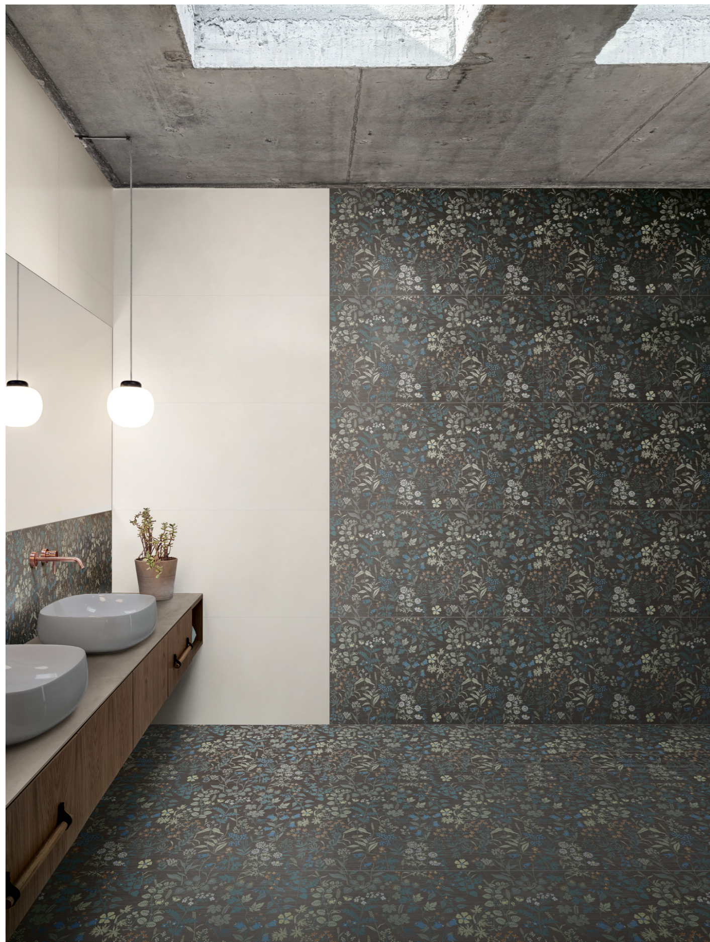
MCSP Poster Ivory Rt 60x120cm MAD8 Poster Decoro Exotic Rt 60x120cm