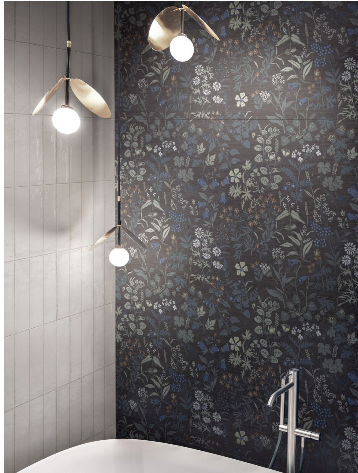
MAD8 Poster Decoro Exotic Rt 60x120cm MA9P Lume Off White Lux 6x24cm