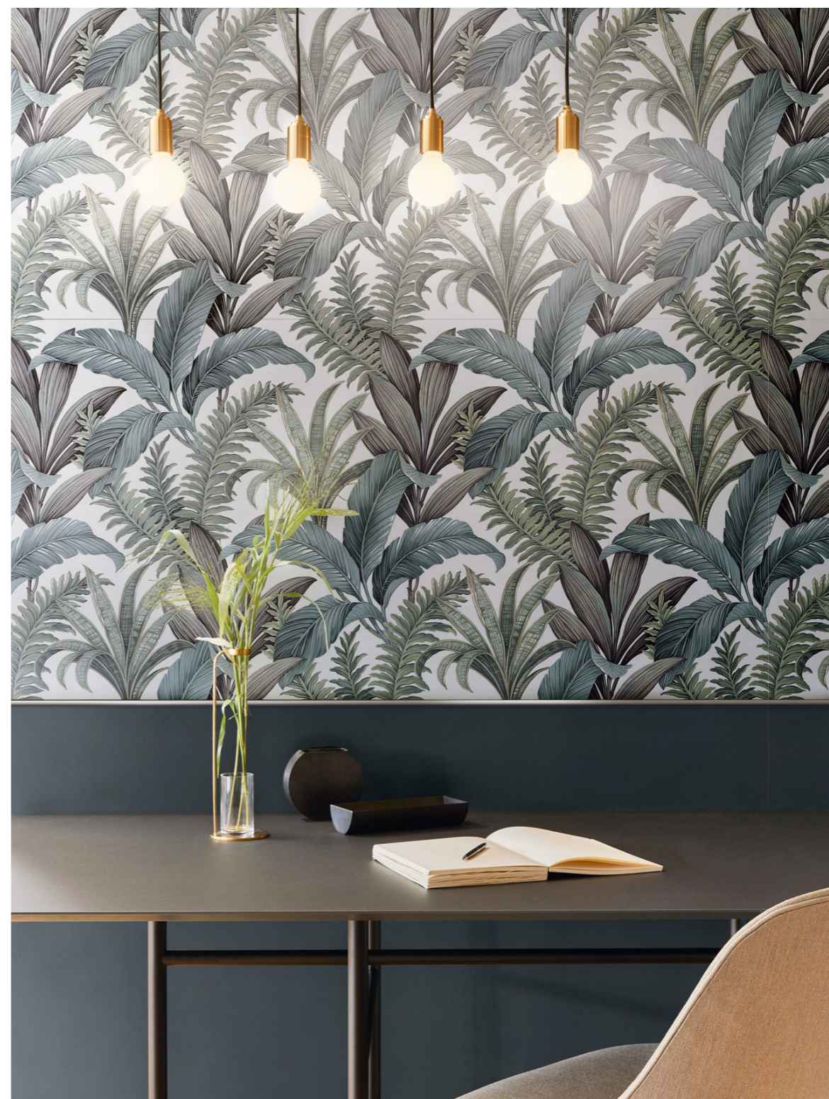
MCSU Poster Blue Rt 60x120cm MAD9 Poster Decoro Hawaii Rt 60x120cm MACN Poster Listello Aluminum 0x120cm