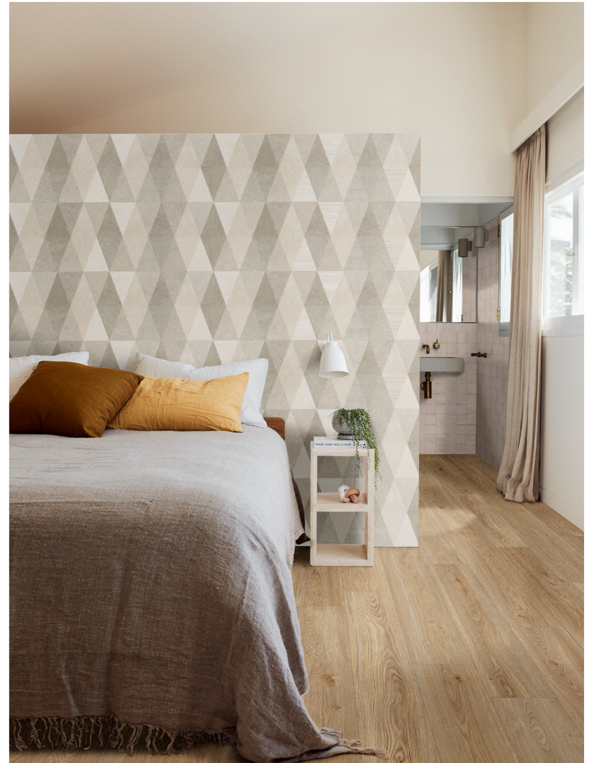
MFDG Alma Rovere Rt 20x120cm MFCR Limestone Wall Decoro Losanga Touch Rt 40x120cm MDSE Confetto Bone 10x10cm