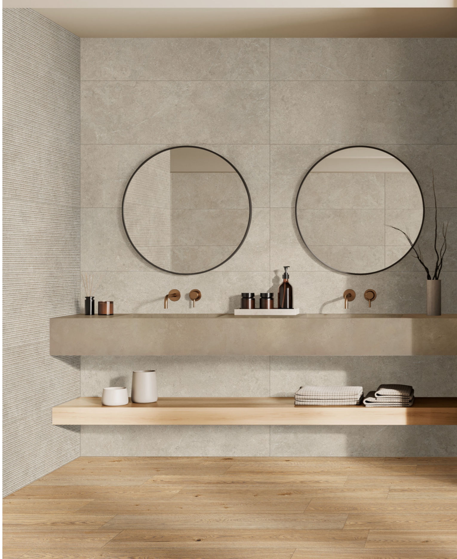
MDSE Confetto Bone 10x10cm M7GT Grande Resin Look Beige Satin Rettificato 120x278cm