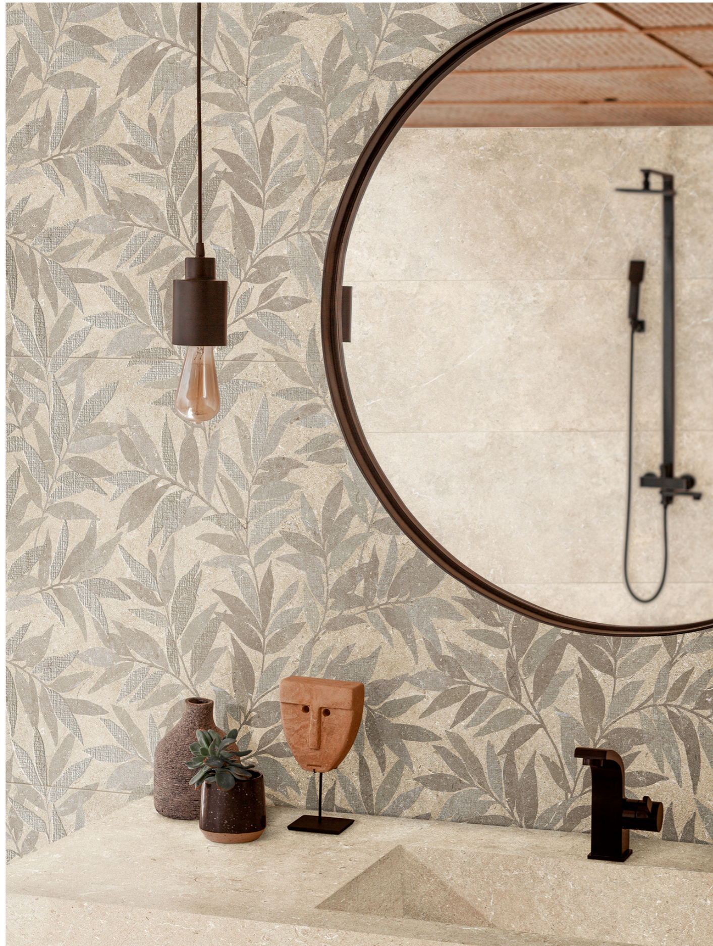
MFDT Limestone Wall Decoro Agrifoglio Sand Touch Rt 40x120cm MFCE Limestone Wall Sand Rt 40x120cm MAGN Grande Stone Look Limestone Sand Satin Rt 6Mm 160x320cm