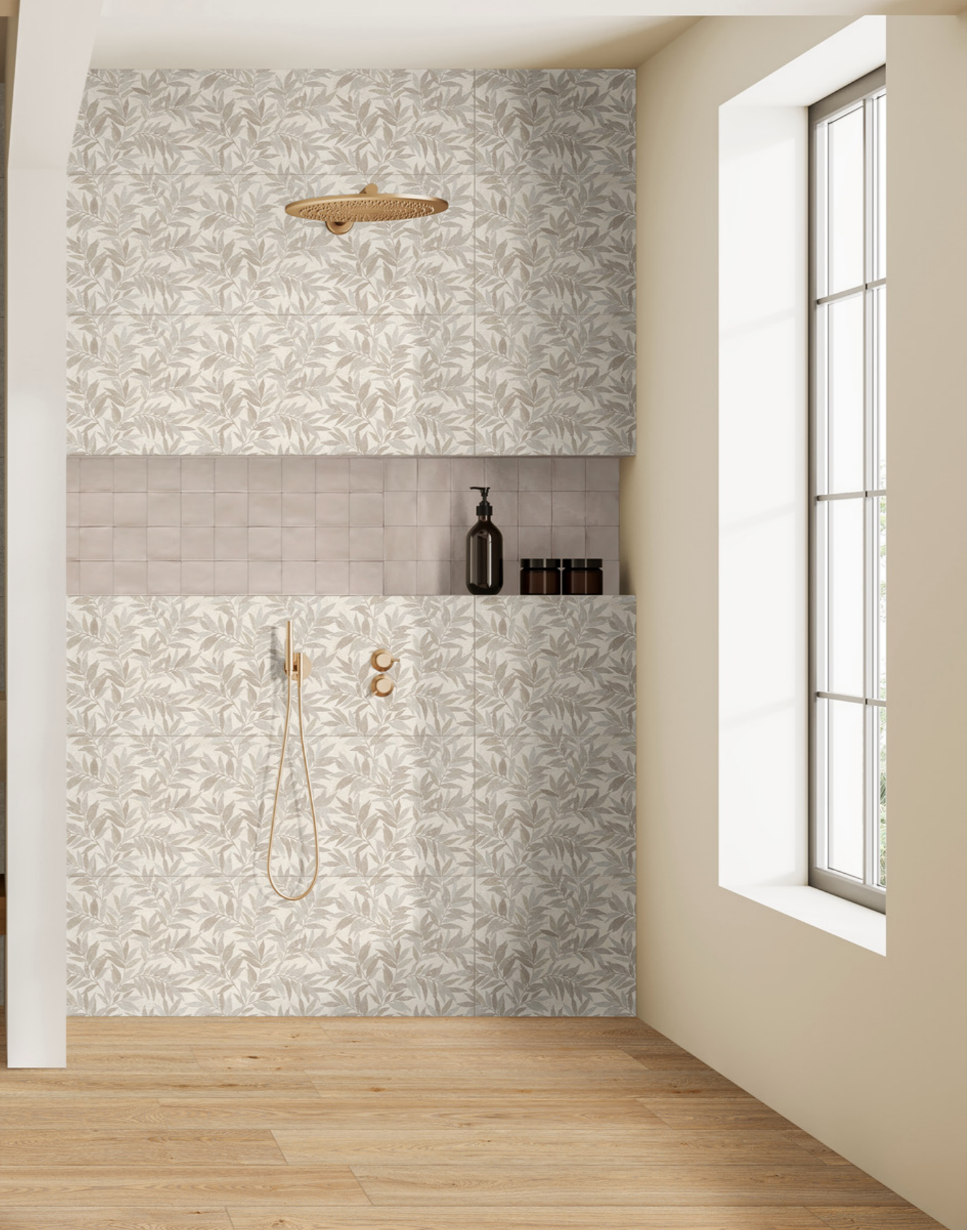
MFCK Limestone Wall Taupe 3D Mikado Rt 40x120cm MFCF Limestone Wall Taupe Rt 40x120cm