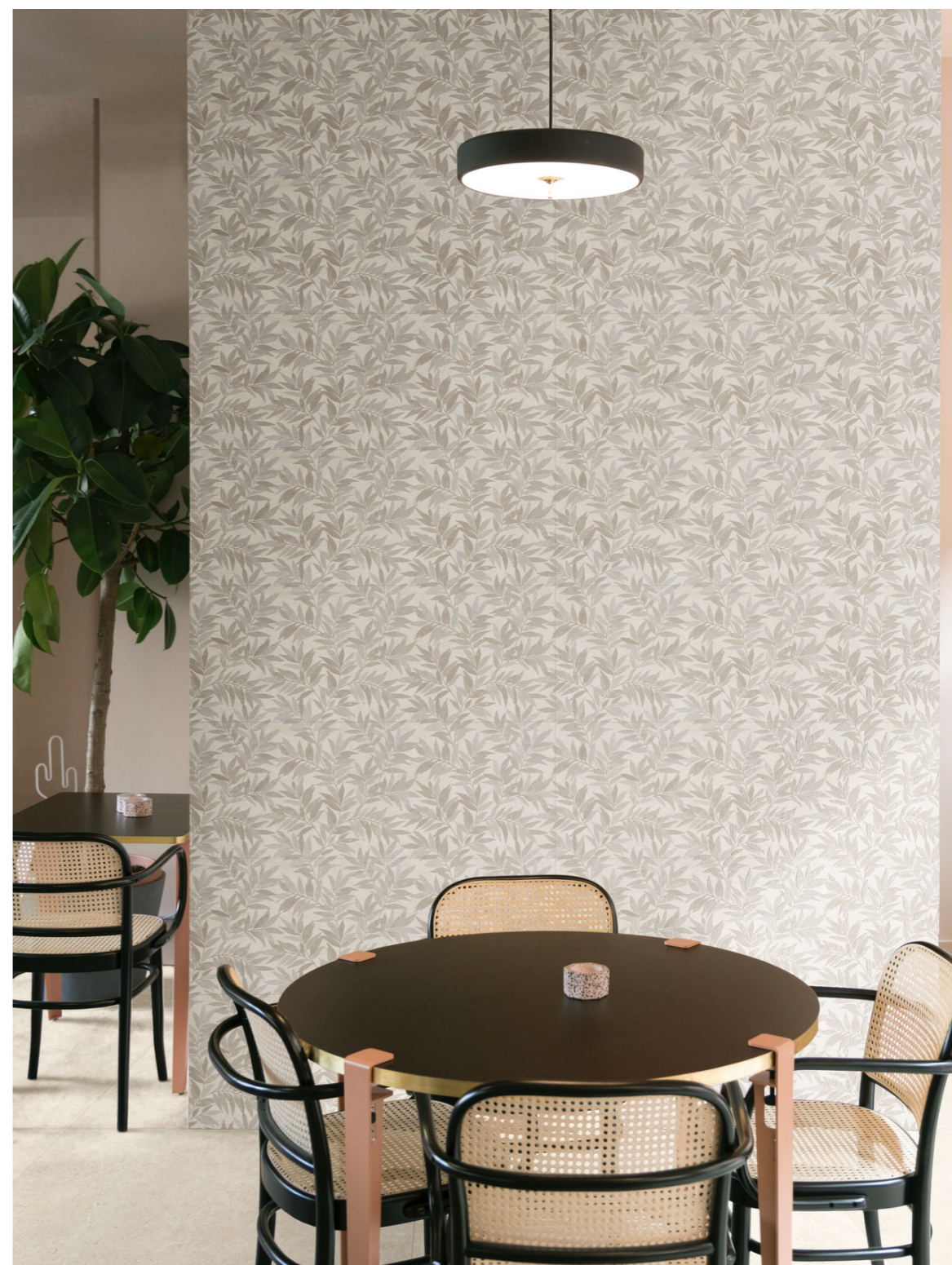
MFCP Limestone Wall Decoro Agrifoglio Ivory Touch Rt 40x120cm M907 Limestone Ivory Rt 120x120cm