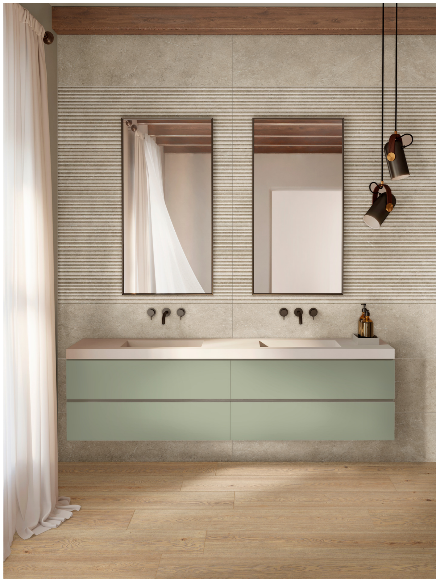
MFDD Alma Beige Rt 20x120cm MFCK Limestone Wall Taupe 3D Mikado Rt 40x120cm MFCF Limestone Wall Taupe Rt 40x120cm