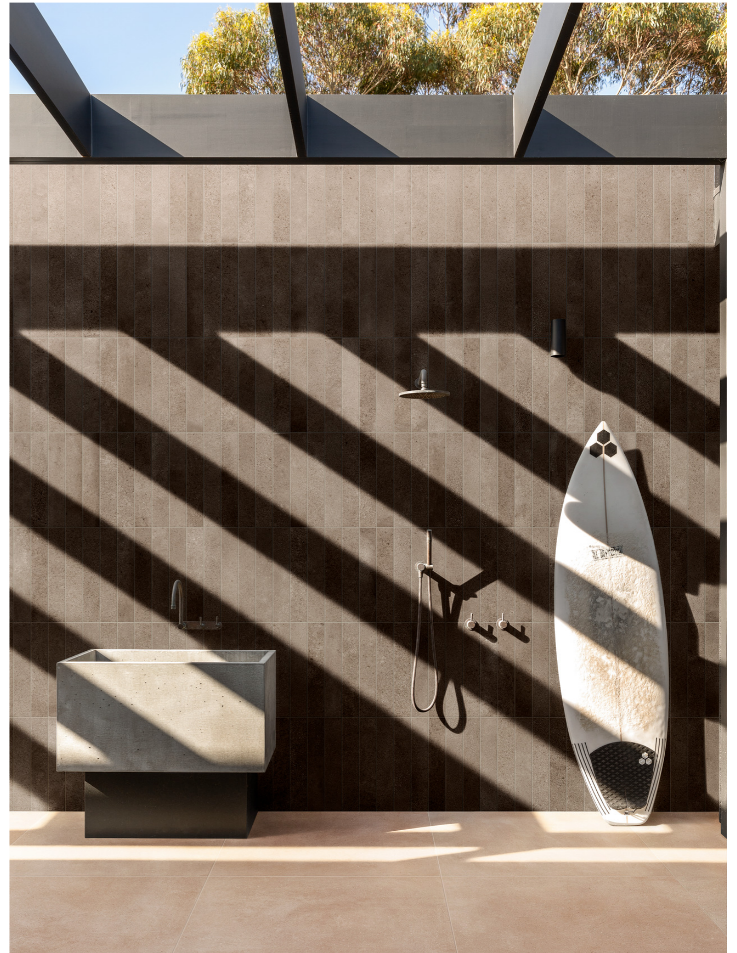
MGU6 Artcraft Argilla 5x30cm MFSU Slow Calce Strutturato 60x60cm