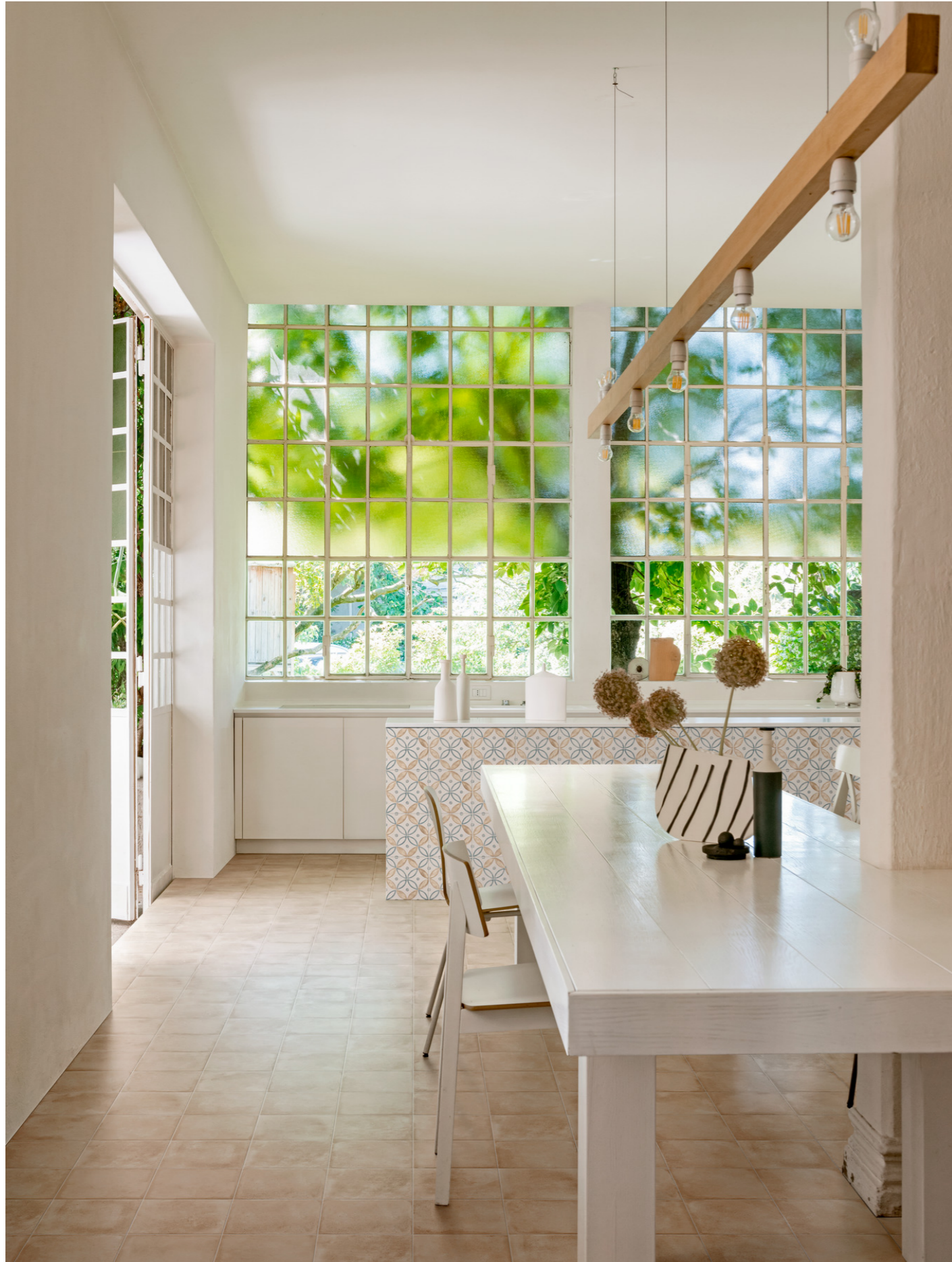
MH9C Artcraft Decoro Segni A Semimatt 20x20cm MGSM Artcraft Calce 20x20cm