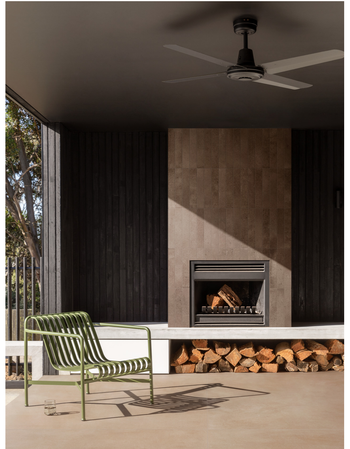
MGU6 Artcraft Argilla 5x30cm MFZS Slow Calce Strutturato 120x120cm