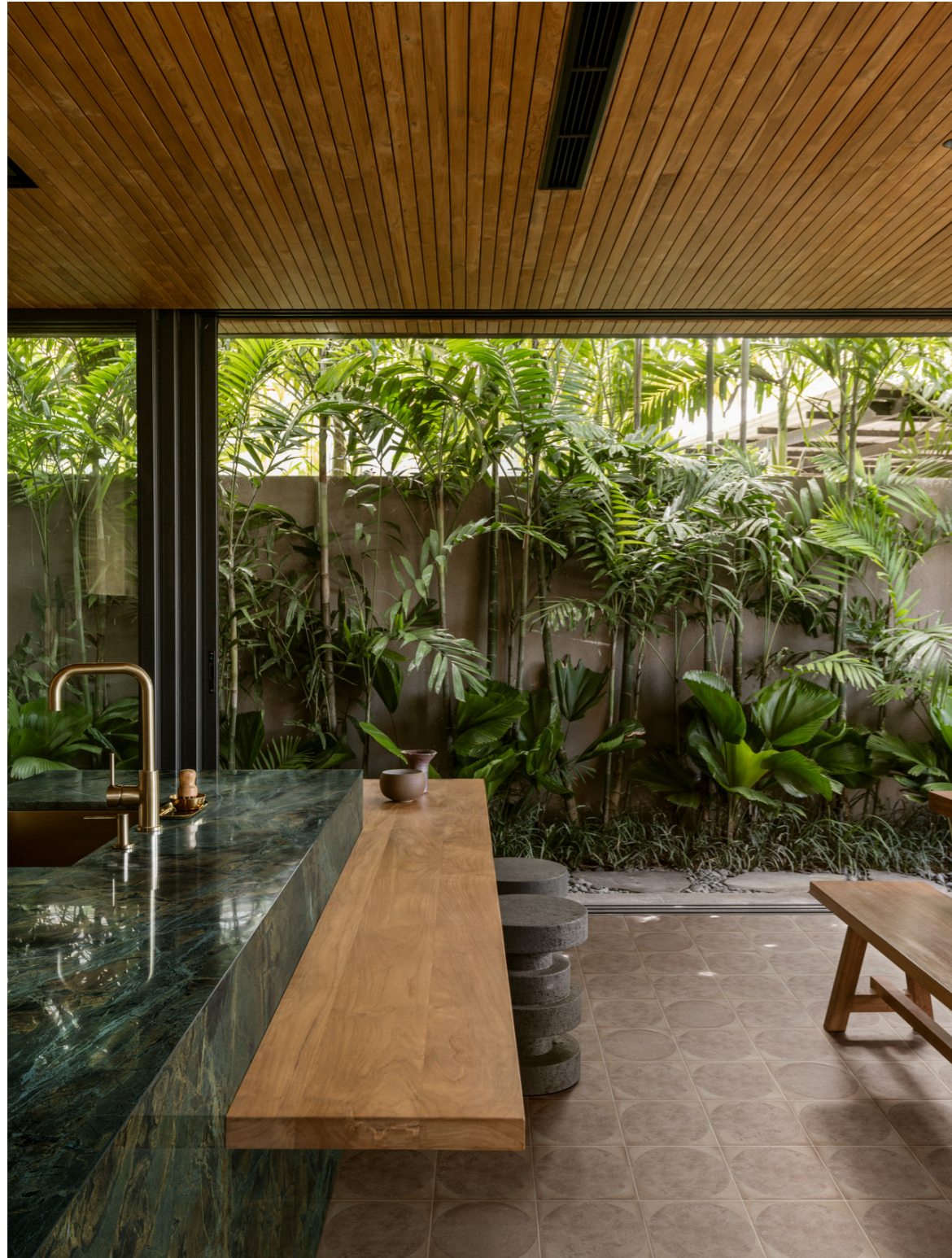
MGWS Artcraft Argilla Decoro Bolli 20x20cm MAFT Grande Marble Look Verde Borgogna Lux Rt 6Mm 160x320cm