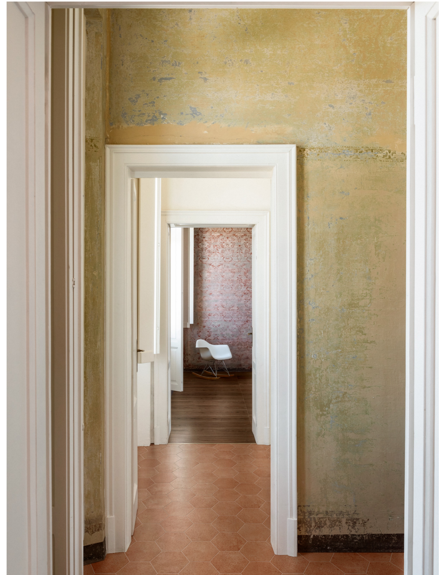
MMD7 Vivo Castano Rt 22x180cm MGSZ Artcraft Cotto 21x18cm