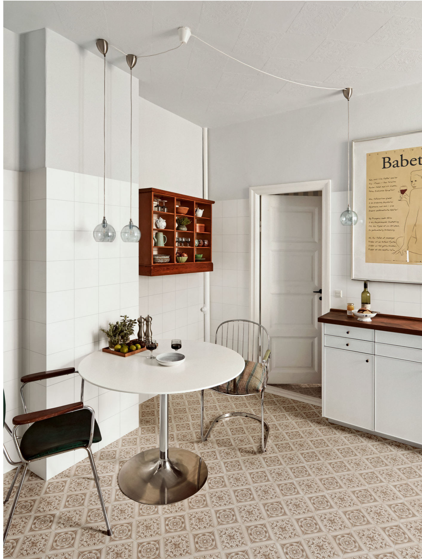
MH5Y Artcraft Pomice Decoro Quadri 20x20cm MGSV Artcraft Bianco Semimatt 20x20cm