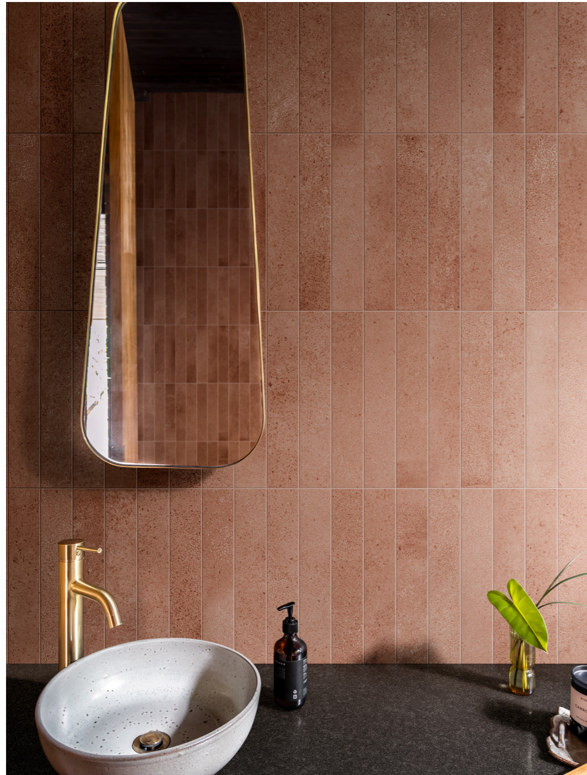
MGU3 Artcraft Cotto 5x30cm M7RE Grande Stone Look Granito Black Satin Rt 6Mm Stuoiato 160x320cm