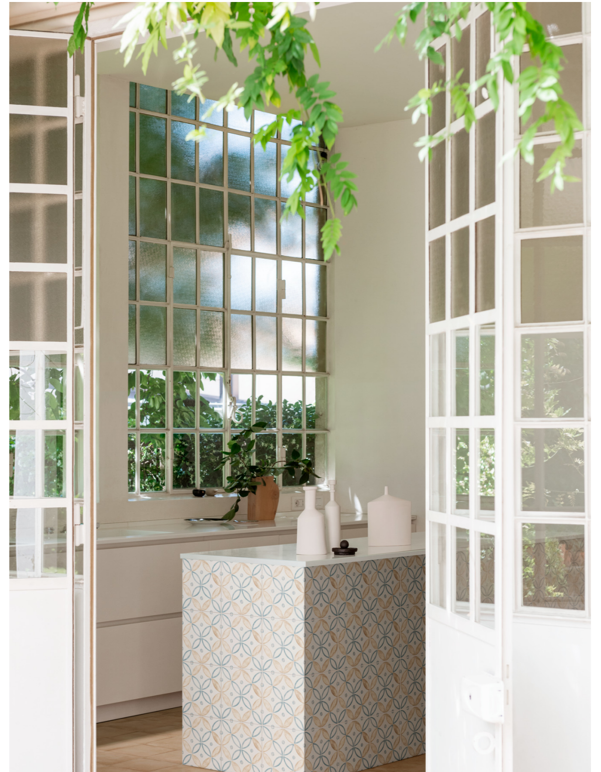
MH9C Artcraft Decoro Segni A Semimatt 20x20cm MGSM Artcraft Calce 20x20cm