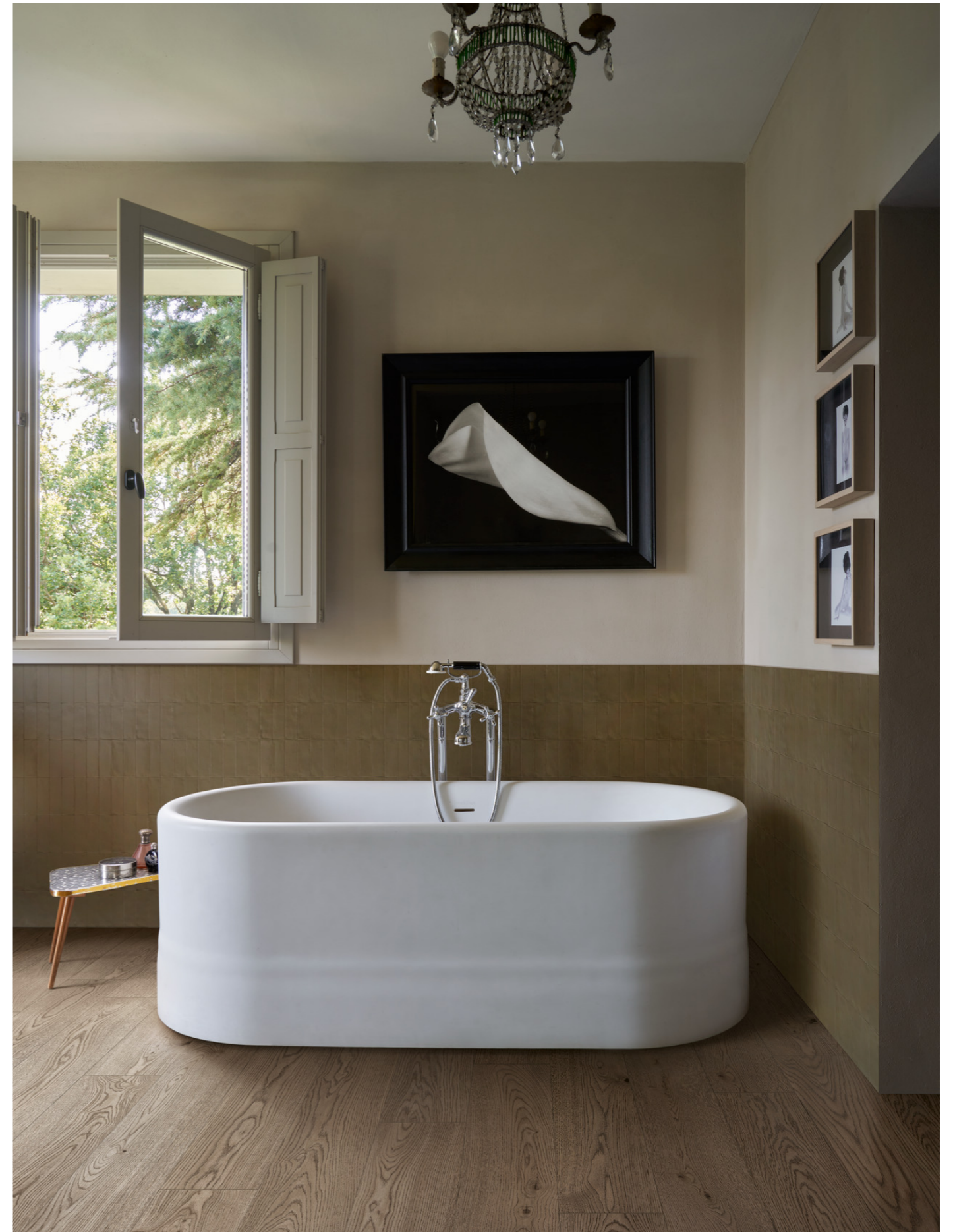
MMDD Vivo Castano Rt 20x120cm MDTR Confetto Kaki 5x15cm