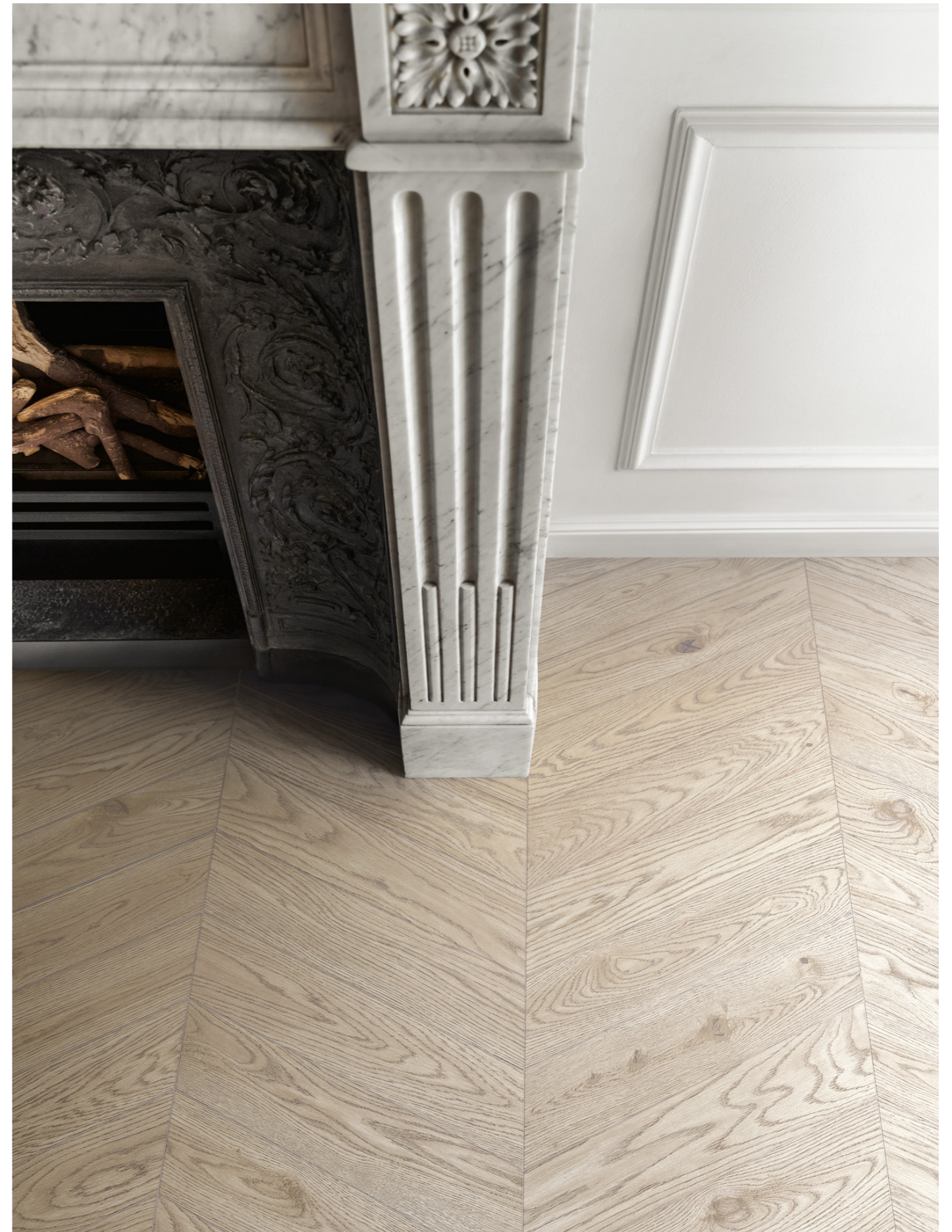
MP3P Vivo Sabbia Chevron 11x54cm