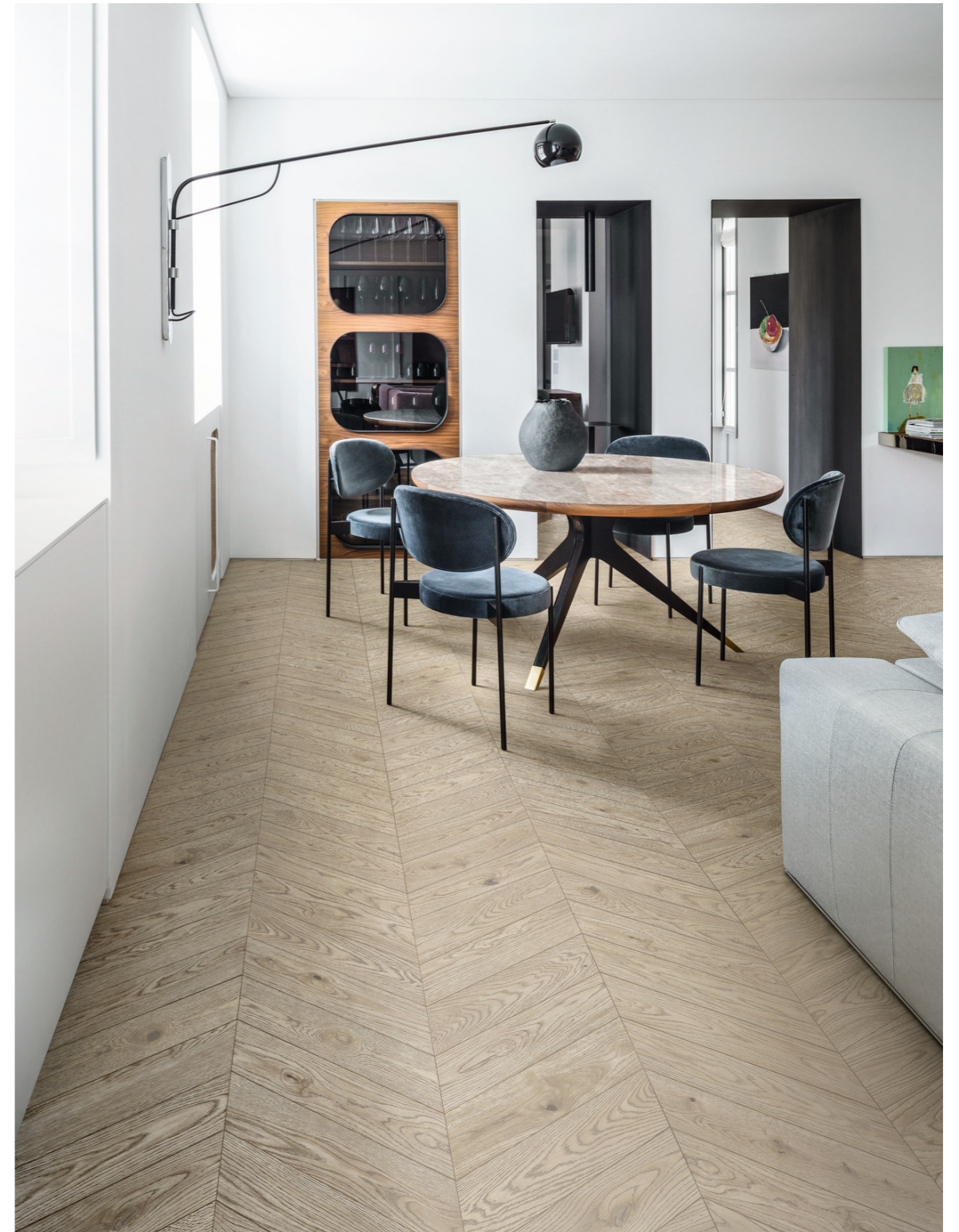
MP3P Vivo Sabbia Chevron 11x54cm MGDP Grande Marble Look Taj Mahal Lux Rt 6Mm 160x320cm