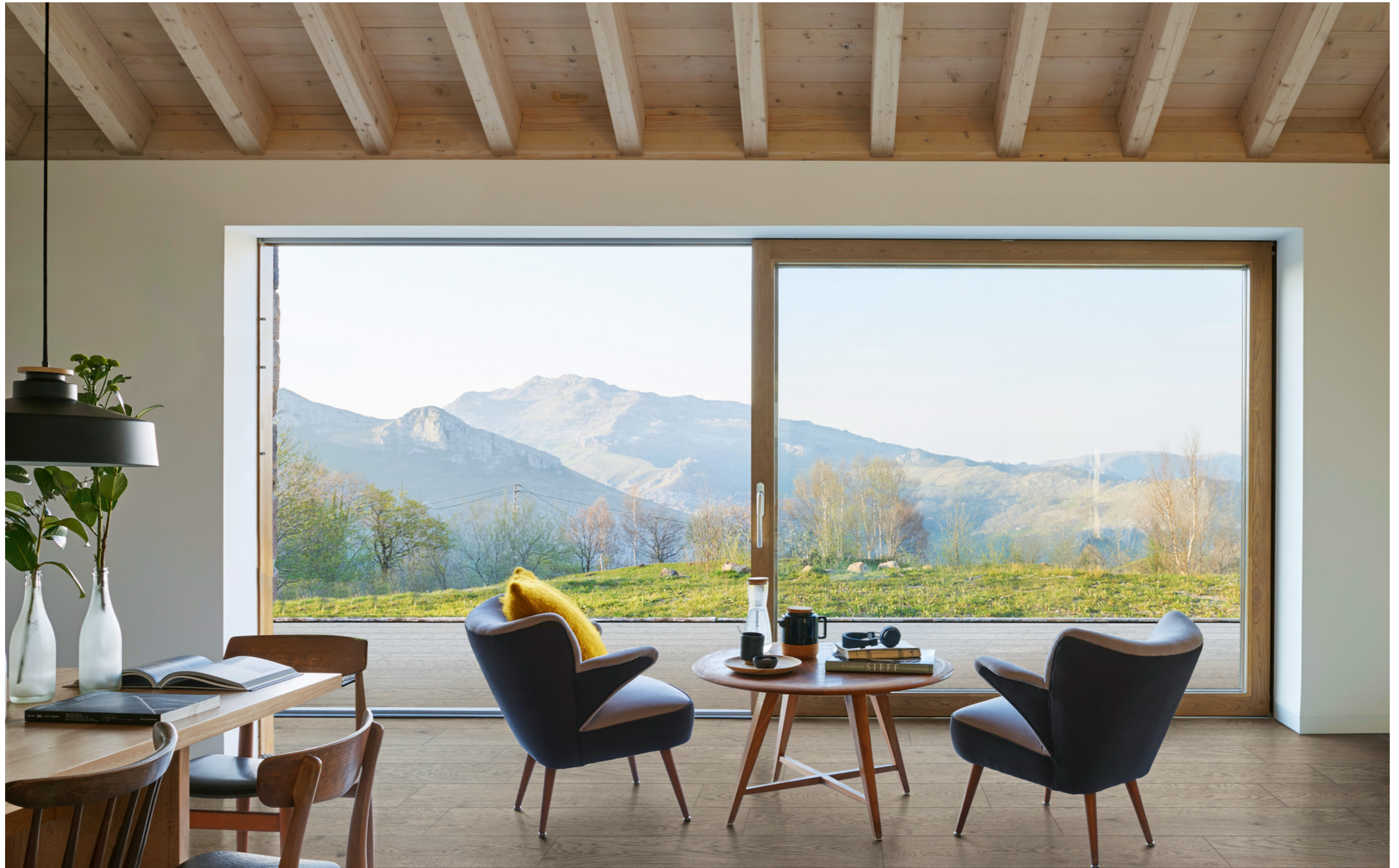
MMDL Vivo Tabacco Grip 20x120cm MMDC Vivo Tabacco Rt 20x120cm