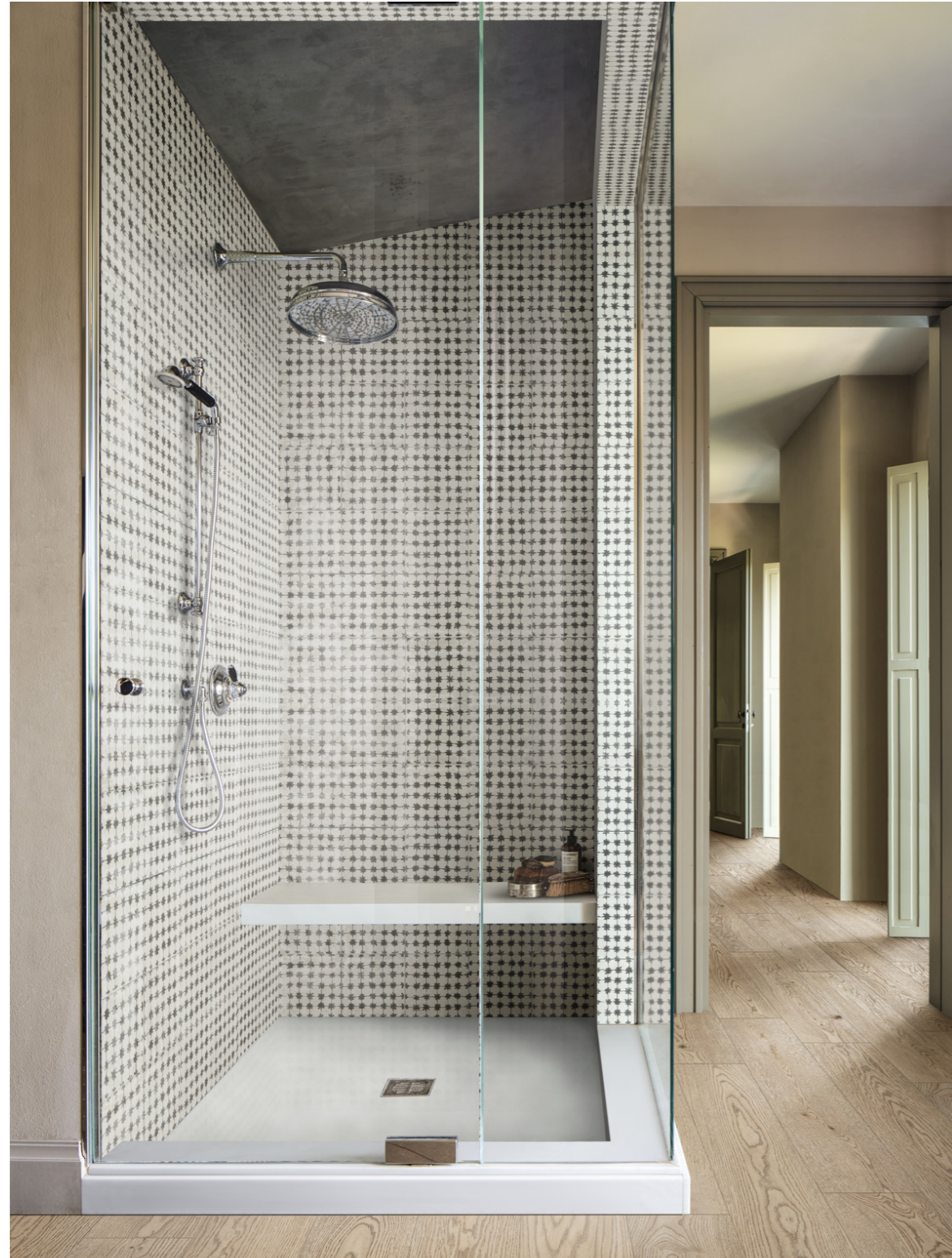
MMDJ Vivo Grano Grip 20x120cm MANM Memoria Tappeto 1 Nero Lux 15x15cm