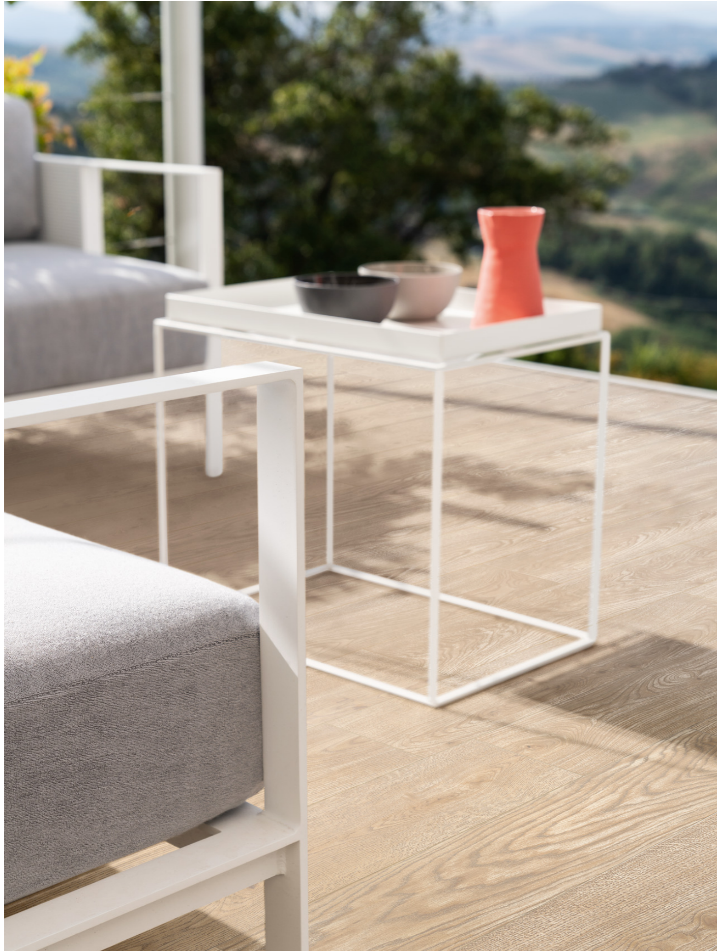
MP3N Vivo Grano Grip Rt 20x150cm