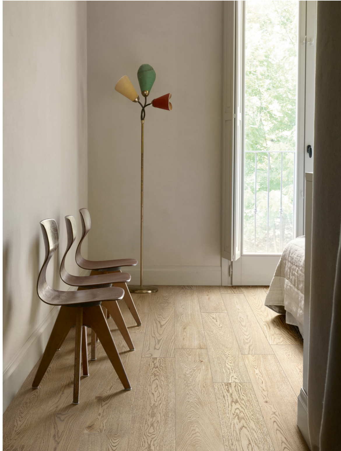
MMDA Vivo Grano Rt 20x120cm