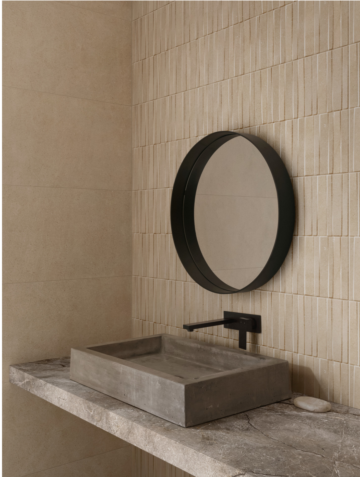
MPCA Slow Wall 3D Dash Calce Rt 40x120cm MPC4 Slow Wall Calce Rt 40x120cm MM19 Grande Stone Look Silver Root Grey Satin 3D Ink Rt 6Mm 160x320cm