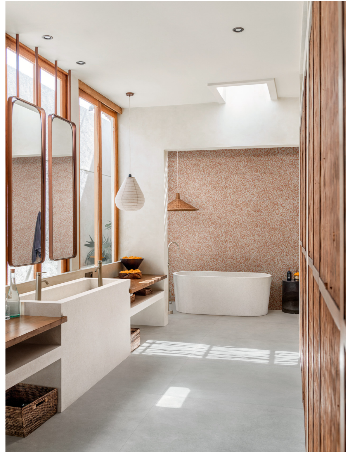
MPCJ Slow Cold Cromo R10 Rt 120x120cm MPAZ Slow Wall Decoro Myrtle Cotto Touch Rt 40x120cm MJWZ Grande Stone Look Berici Bianco Satin 3D Ink Rt 6Mm 160x320cm