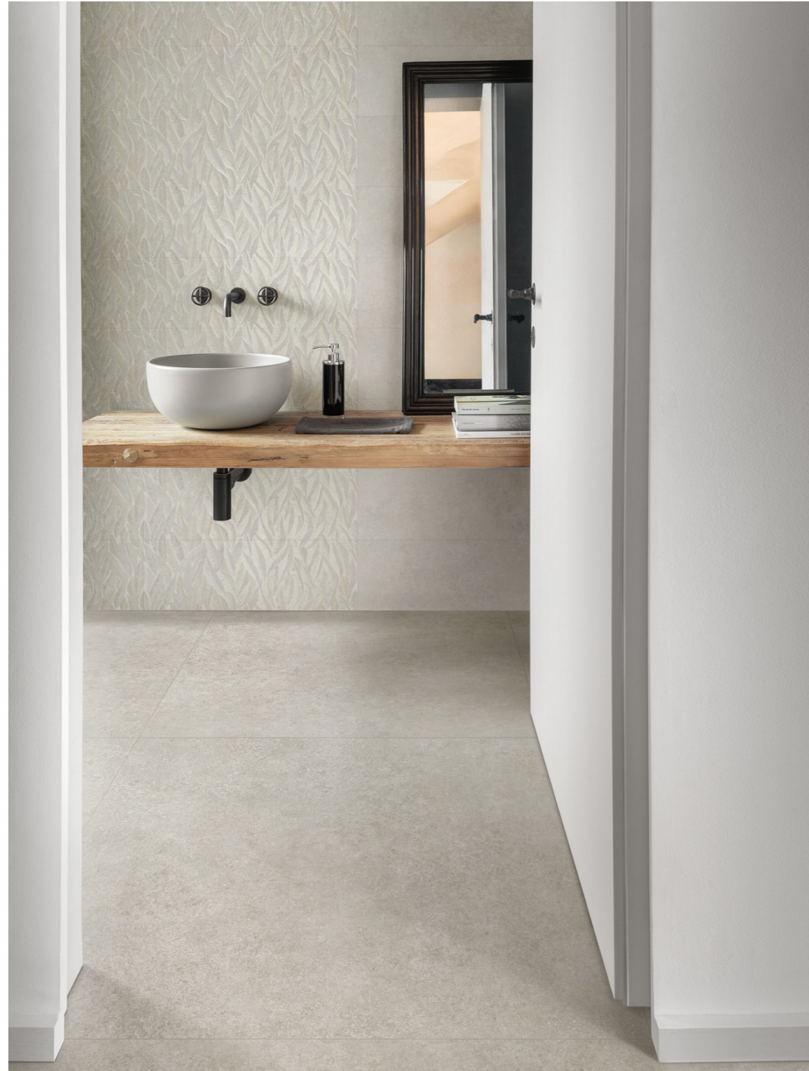
MP6K Room Bianco Rt 100x100cm MP6F Room Wall Decoro Oleander Touch Rt 30x90cm MP67 Room Wall Bianco Rt 30x90cm