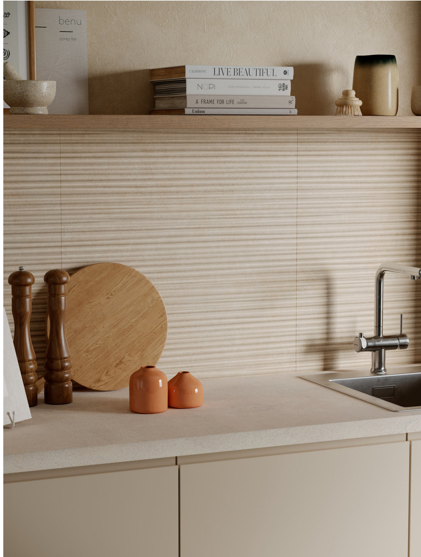
MQ7J Room Wall 3D Blaze Beige 20x60cm MGSF Grande Concrete Look Cementum Ash Natural Rt 6Mm 160x320cm