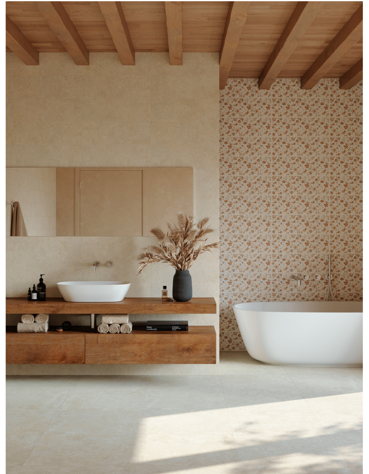
MQ7L Room Wall Bianco Decoro Romantic Rt 20x60cm MQ7D Room Wall Bianco 20x60cm MP79 Room Bianco Rt 60x60cm