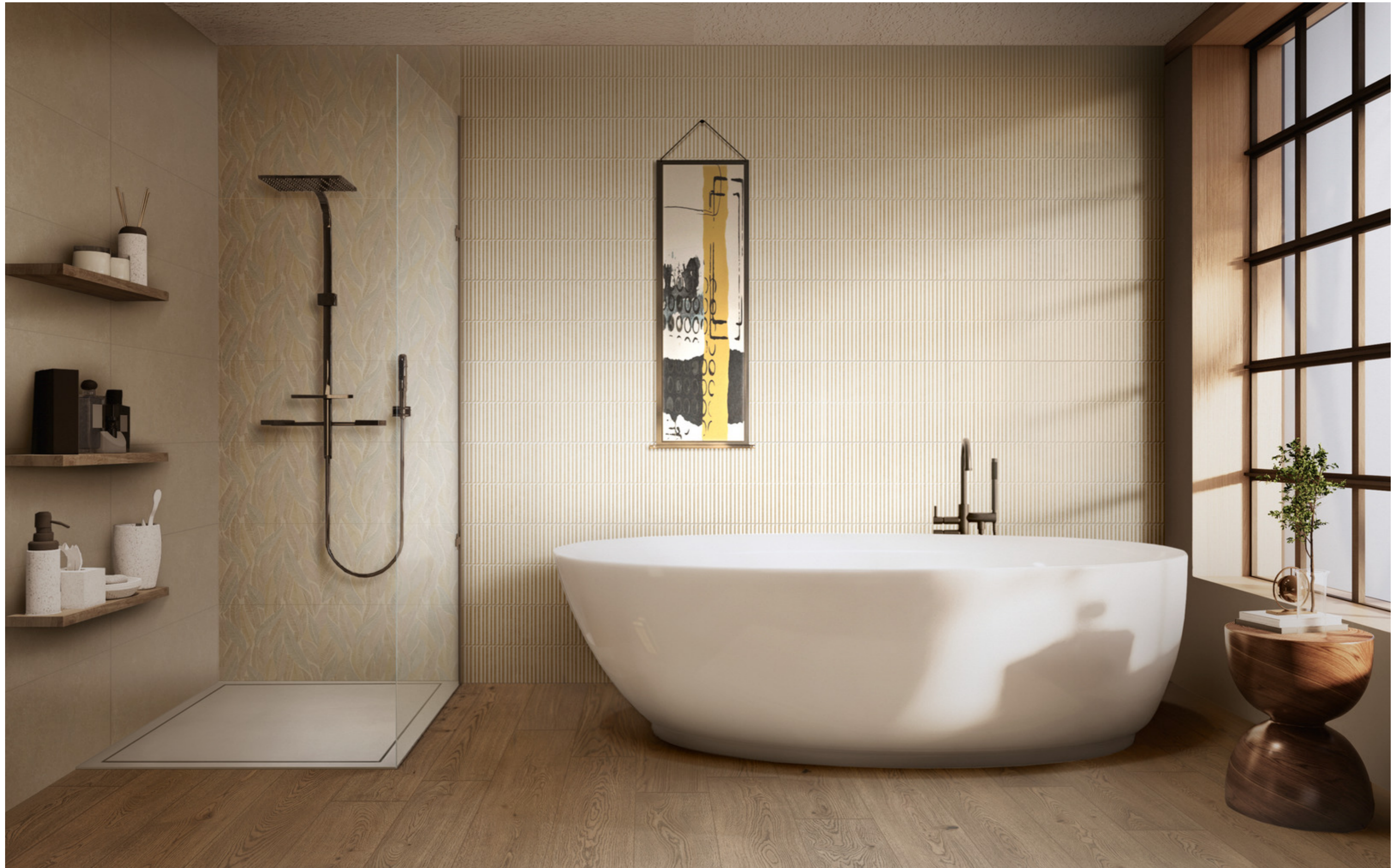
MP66 Room Wall Taupe Rt 30x90cm MMDC Vivo Tabacco Rt 20x120cm