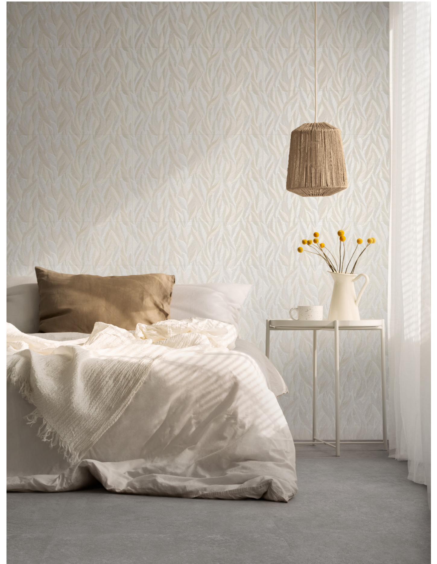
MP8C Room Antracite Rt 60x120cm MP6F Room Wall Decoro Oleander Touch Rt 30x90cm