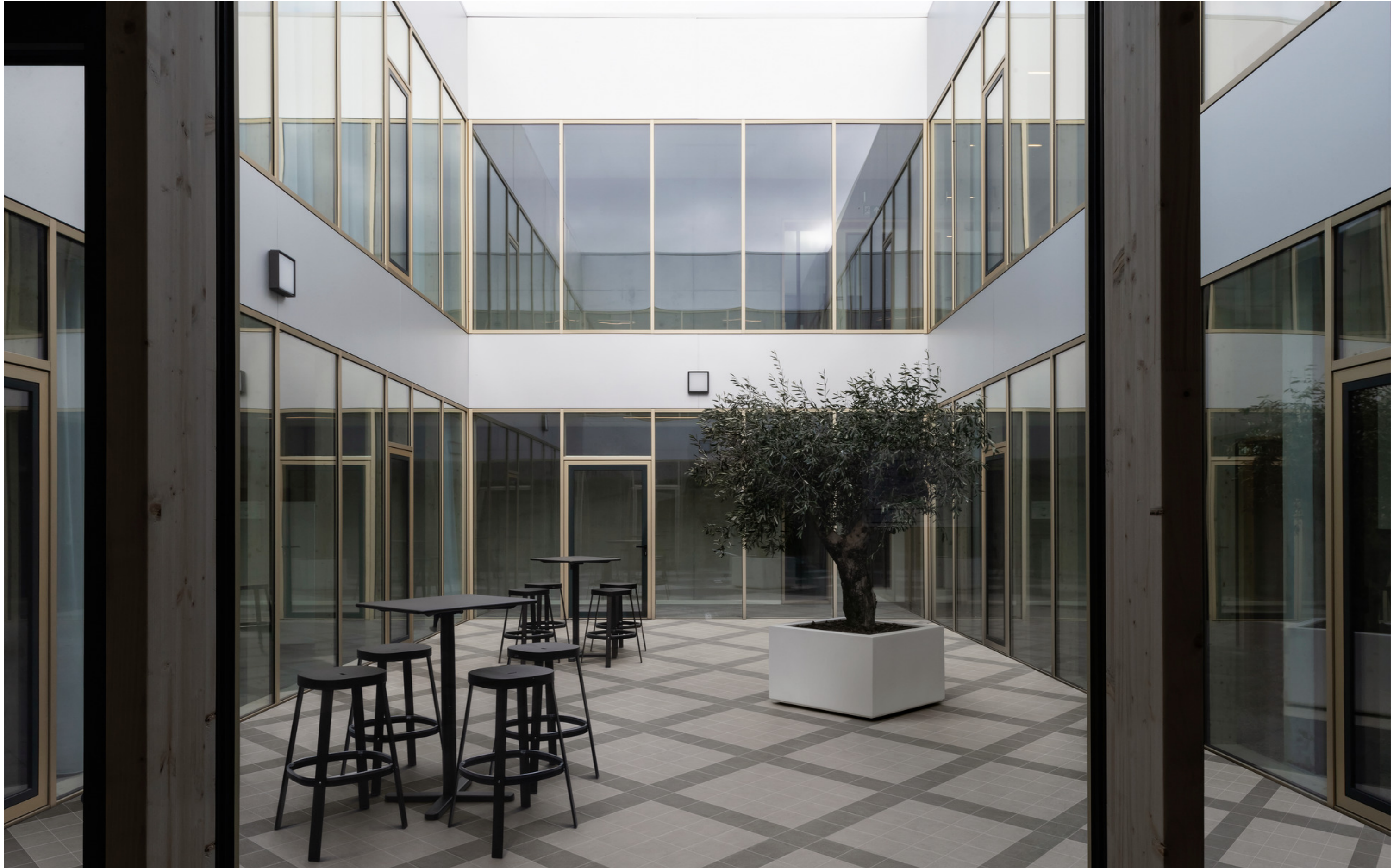
MPNR Sentieri Lead 15x15cm MPNP Sentieri Nickel 15x15cm