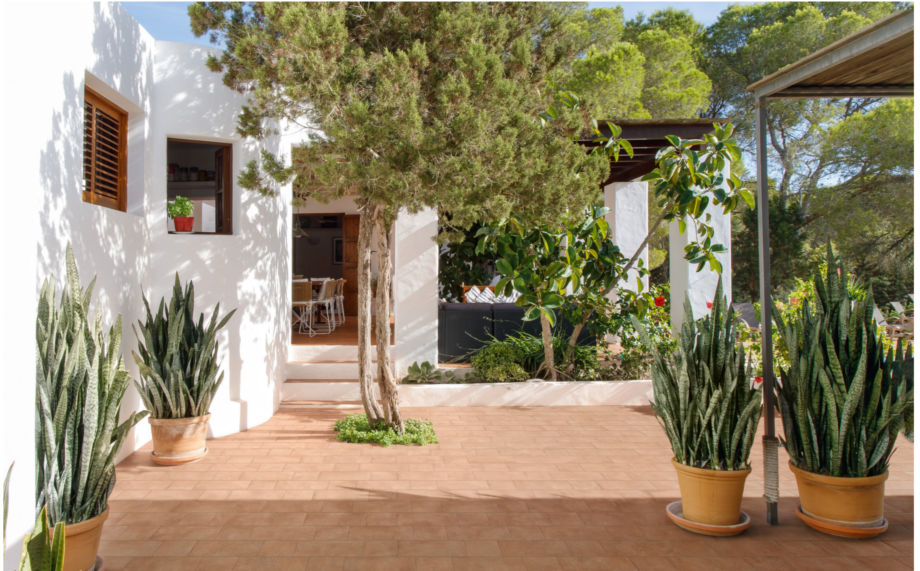
MPNY Sentieri Cotto 15x30cm MPNN Sentieri Cotto 15x15cm