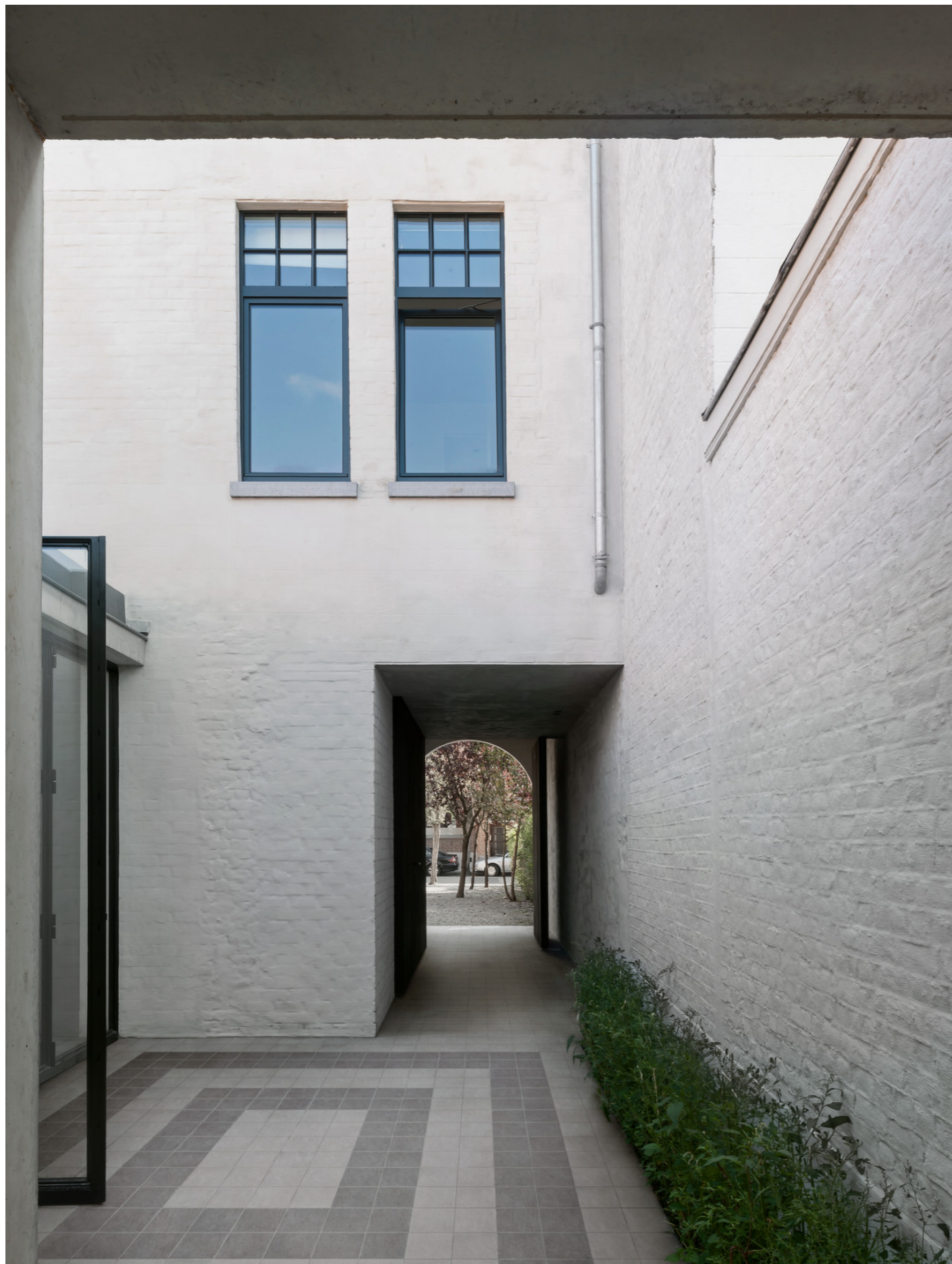
MPNR Sentieri Lead 15x15cm MPNP Sentieri Nickel 15x15cm