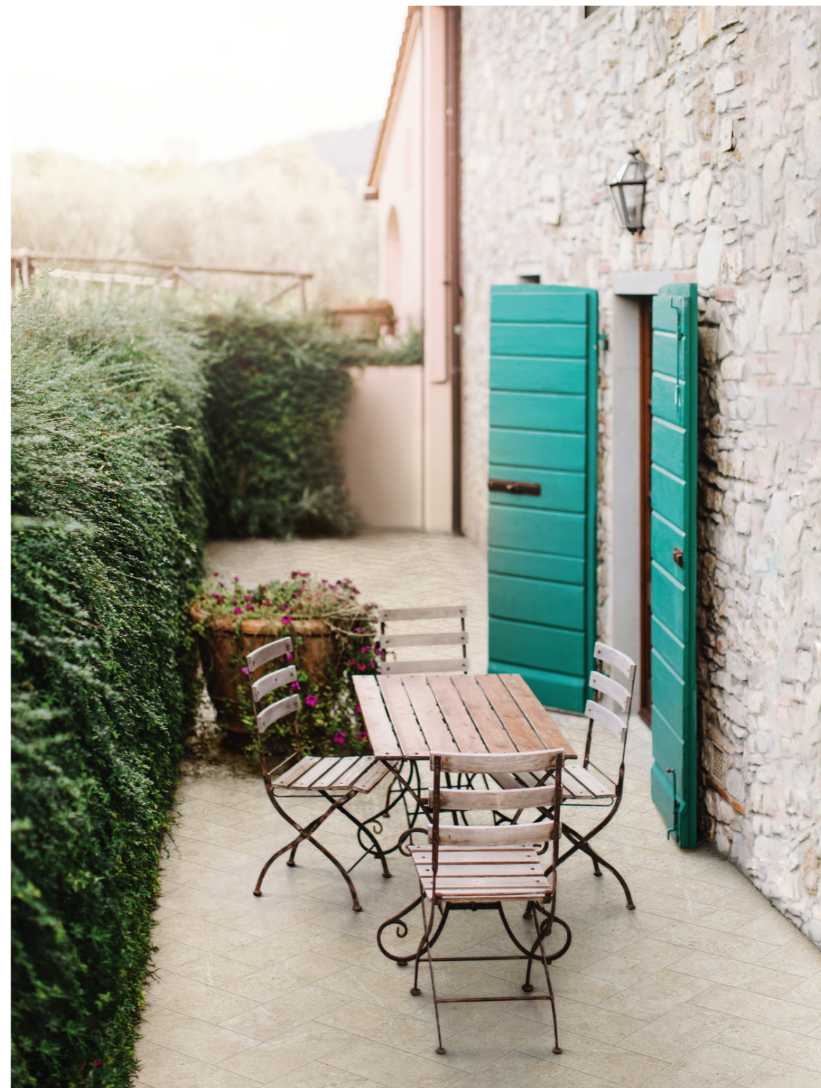
MPNT Sentieri Sand 15x30cm