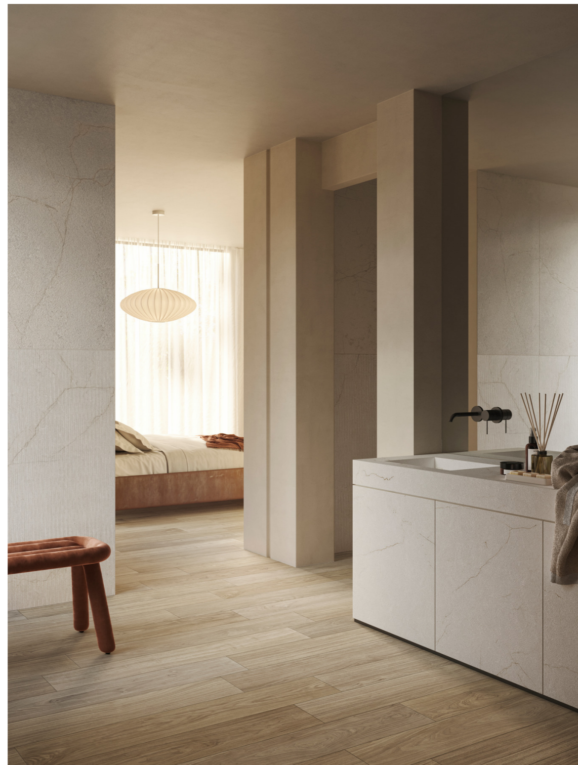
MQE7 Mystone Pietra Di Sicilia Bianco Rigato Rt 60x120cm MQE5 Mystone Pietra Di Sicilia Bianco Puntinato Rt 60x120cm MQ9E Grande Stone Look Pietra Di Sicilia Bianco Naturale 3D Ink Rt 120x278cm MQ93 Nobilis Noce Sbiancato Rt 20x120cm