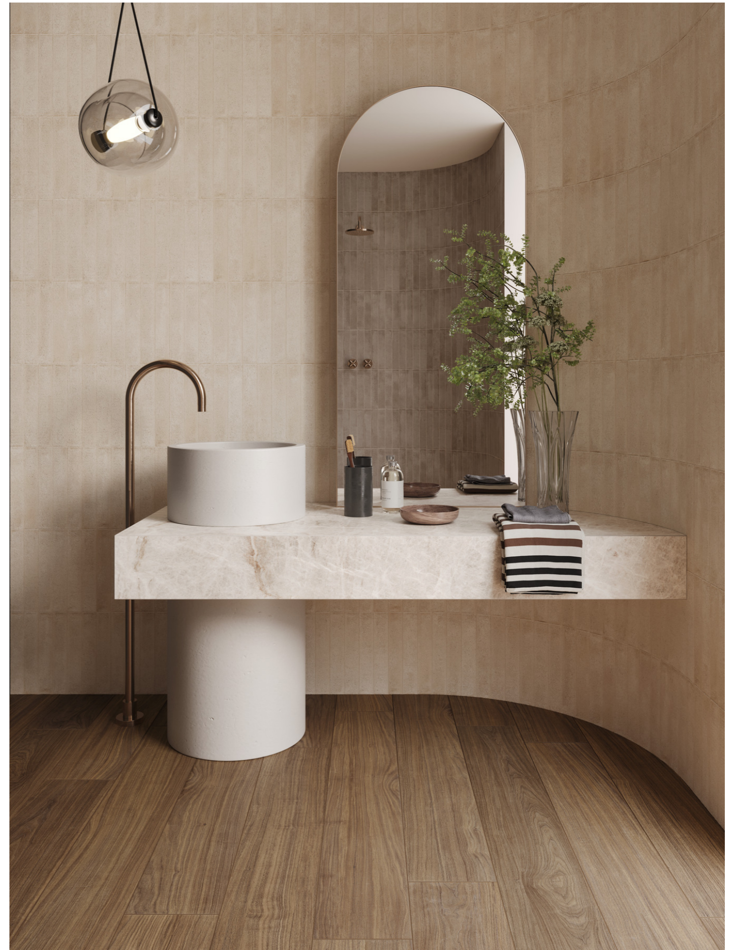
MQ91 Nobilis Noce Classico Rt 20x120cm MGU6 Artcraft Argilla 5x30cm MGTA Artcraft Pomice 5x30cm MGDM Grande Marble Look Taj Mahal Satin Rt 6Mm 160x320cm