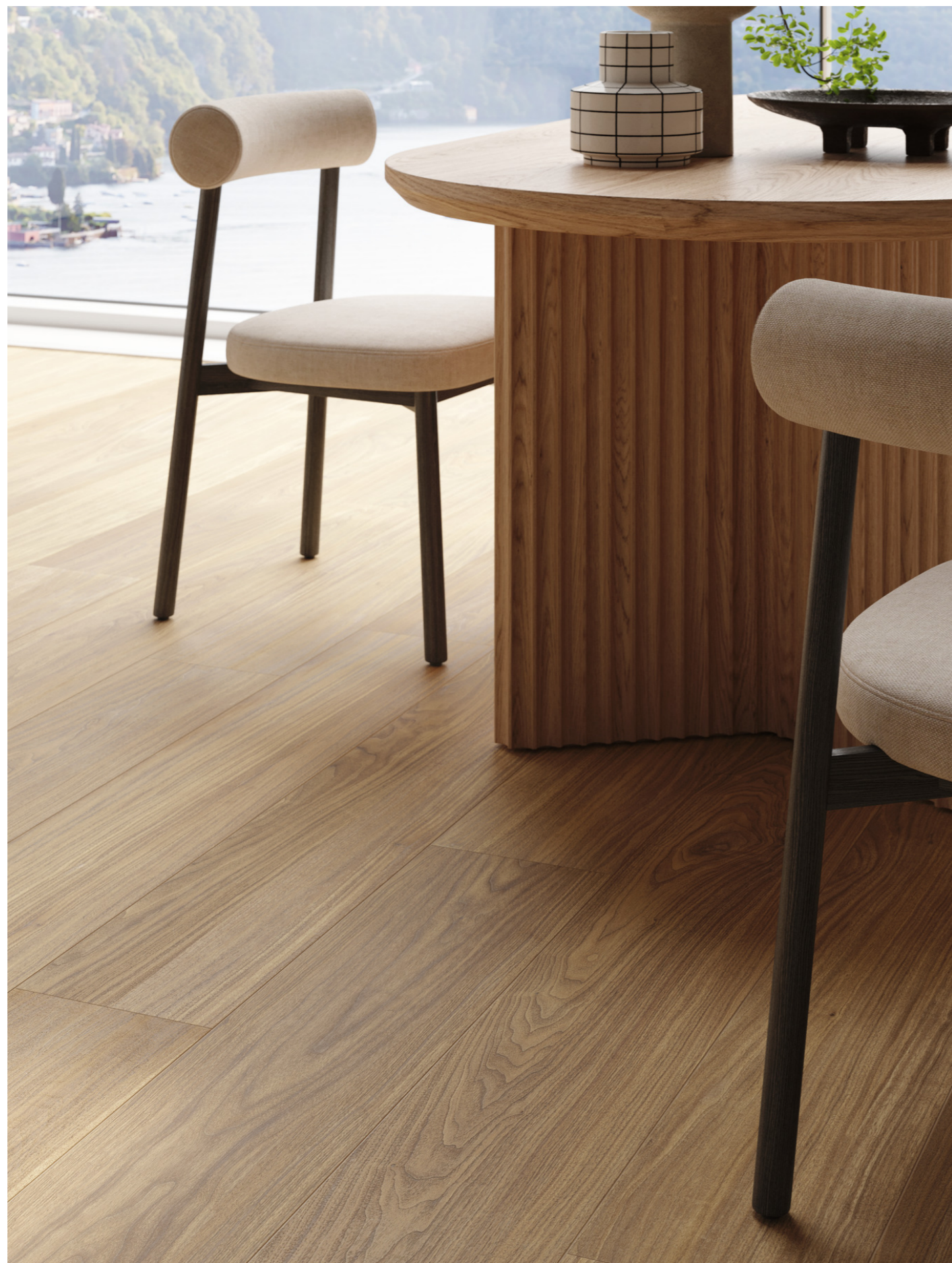
MQ99 Nobilis Noce Natural Rt 22x180cm