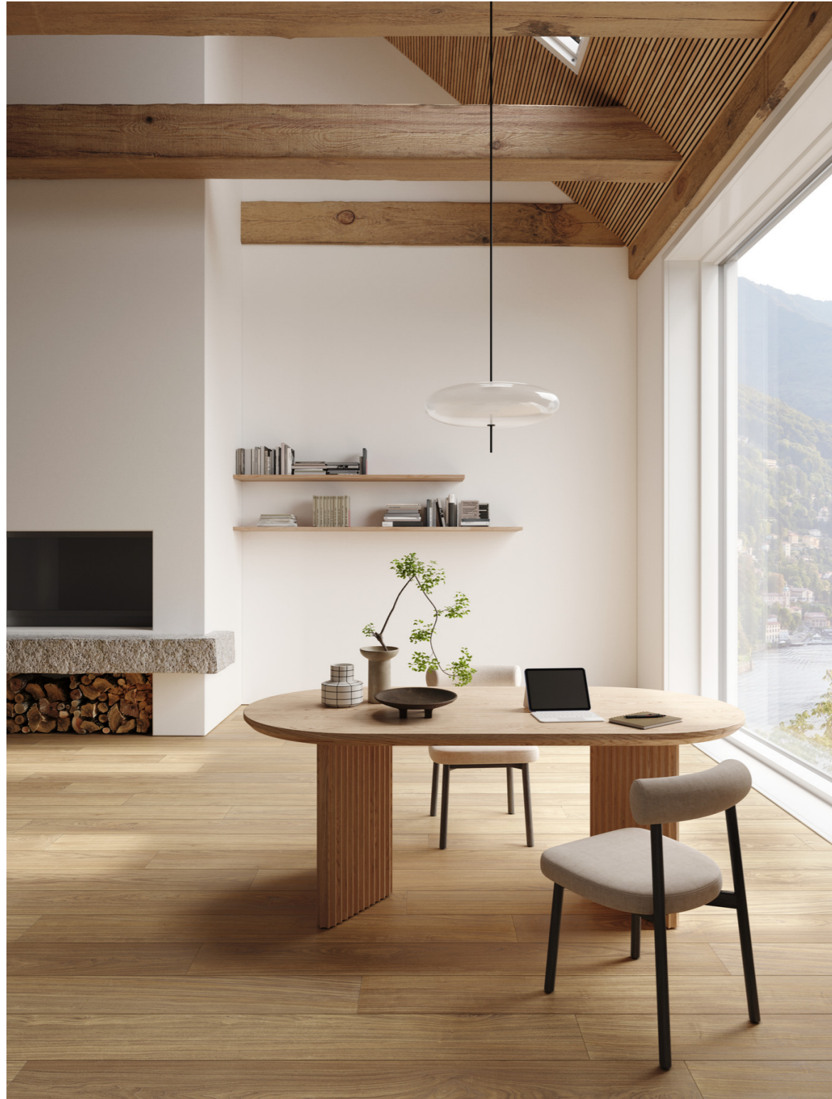
MQ99 Nobilis Noce Natural Rt 22x180cm