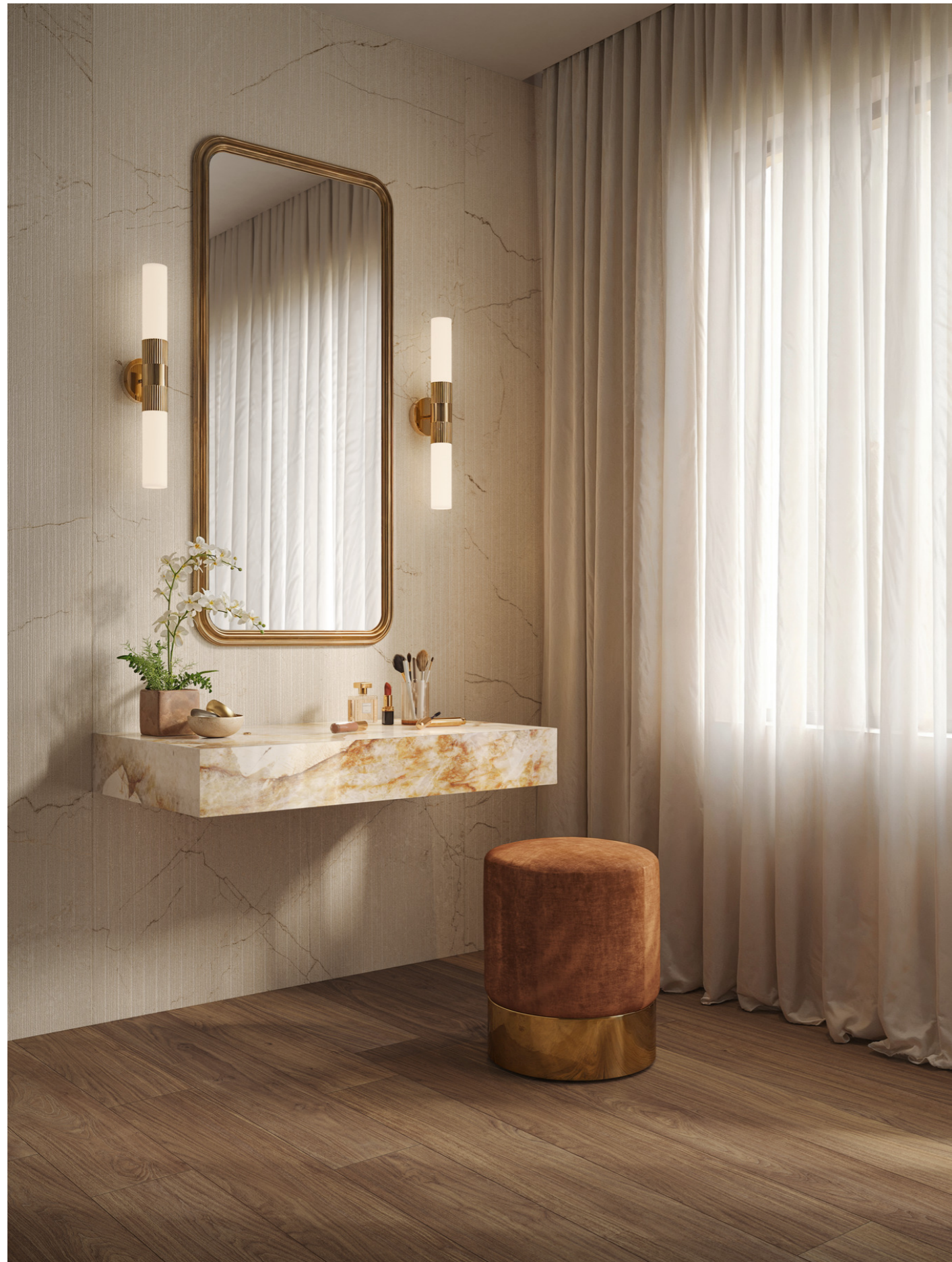
MQ9F Grande Stone Look Pietra Di Sicilia Beige Riga Naturale 3D Ink Rt 120x278cm MQ91 Nobilis Noce Classico Rt 20x120cm MGFS Grande Marble Look Patagonia Lux Rt 6Mm 160x320cm