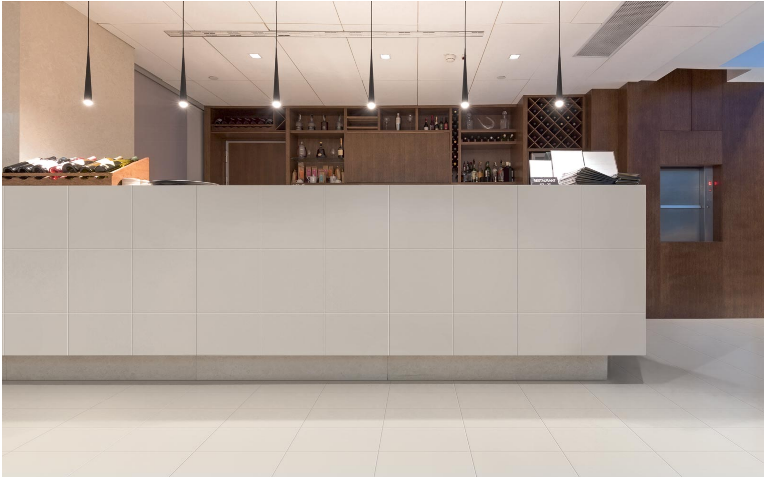
MHMZ Bianco_C 30X30 30x30cm MHMM Grigio Chiaro_C 30X30 30x30cm